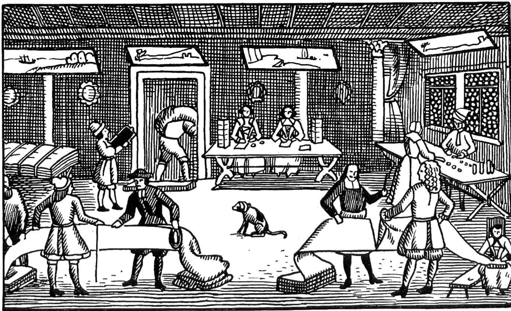
Der fertige Stoff wurde mit dem amtlichen Masse, dem aus Leder bestehenden „Leinwandring“ gemessen (vorn links) und in die für den Verkauf bestimmten Stücke zerschnitten. — Vor der Bürgermange, dem „Tuchhaus“, wie man es in späterer Zeit nannte, fand die Zurüstung für den Transport der Leinwand statt (nächstes Bild).