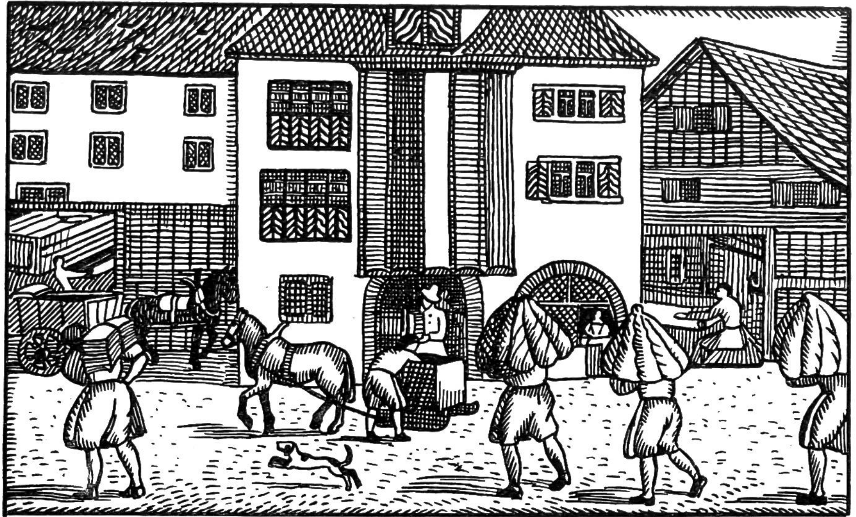
Die weniger feinen Leinwandsorten waren zum Färben und Bedrucken bestimmt. Wir sehen hier bereits die gefärbten Tücher; sie sind an der Dachrampe eines Färberhauses, deren es in der Stadt mehrere gab, aufgehängt.