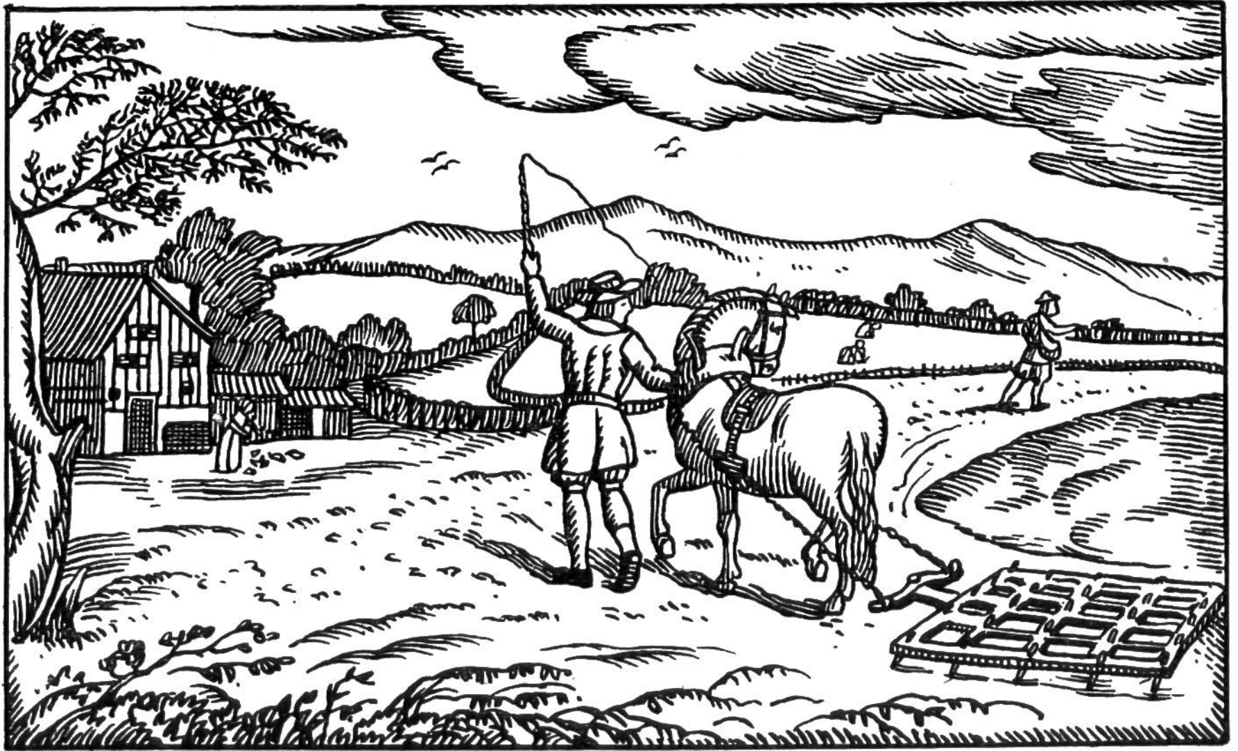
Aus dem Leinwandgewerbe im alten St. Gallen. War der Boden durch Pflug und Egge aufgelockert, wurde der Leinsamen gesät. Das Ernten der Stengel geschah durch Raufen oder Schneiden mit der Sichel. (Fortsetzung auf den nächsten Bildern.)