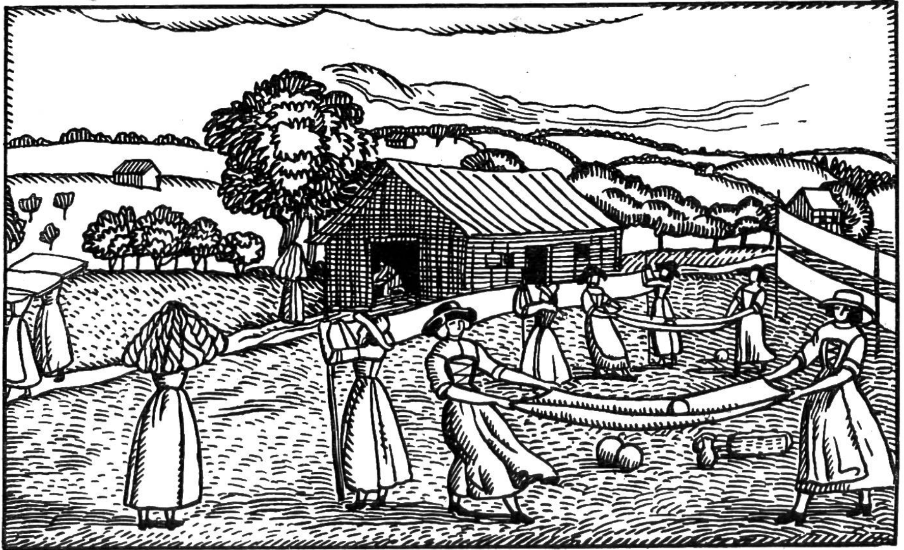
Nach der Abnahme von den Bleicheplätzen wurde die Leinwand mit Hilfe von Stützen gespannt und getrocknet. Darauf folgte das Strecken; man zog an beiden Enden und liess auf dem Tuch eine Kugel herumrollen.