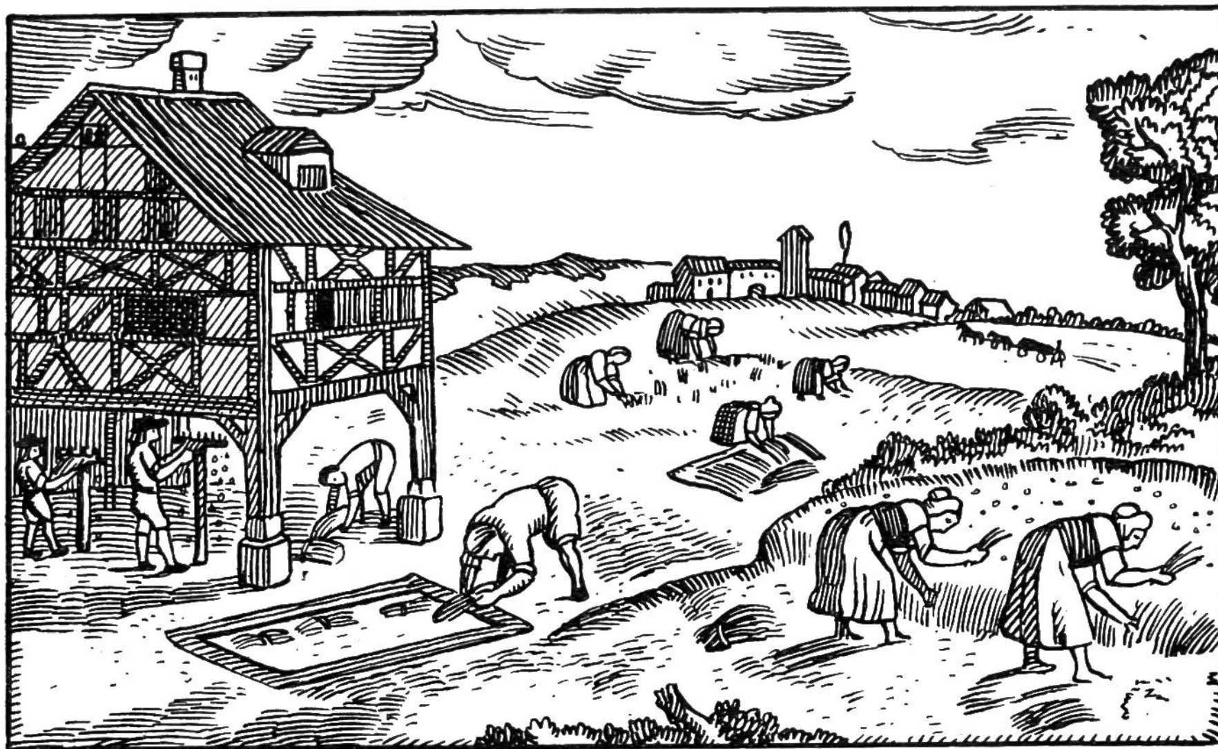
Mannigfache Arbeit erforderte die Gewinnung der Gespinnstfaser aus dem Stengel; sie lag in erster Linie den Frauen ob. Nach Entfernung der Samenkapseln von den Stengeln (mit „riffeln“ bezeichnet), kam das Einweichen in fließendem Wasser, das sogenannte „Rözen“.