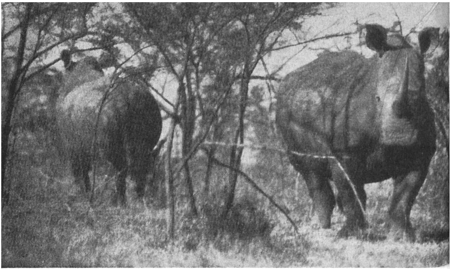
Afrikanische Nashörner im Krüger-Nationalpark. Es handelt sich hier um das sogenannte weisse Nashorn. Die Bezeichnung ist irreführend; denn in Wirklichkeit