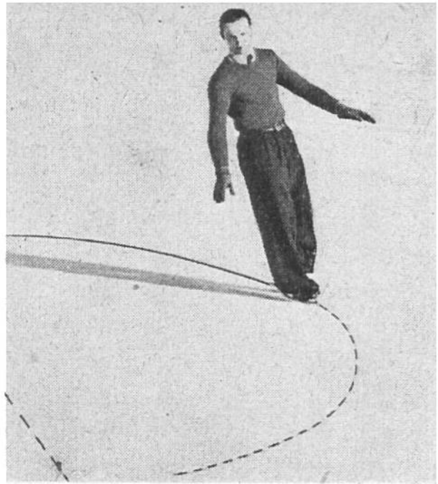
Bogenachter rechts vorwärts-auswärts (rva).

figuren sind. Aber wenn ihr einmal vorwärts und rückwärts fahren könnt, die Bogen auswärts und einwärts und etwa einen „Dreier“ beherrscht, werdet ihr das Lustgefühl des Gleitens und Schwebens auf dem Eise erleben.