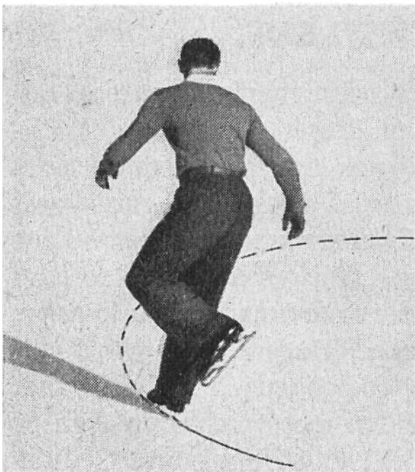
Körperhaltung, wie sie nicht sein soll.

Schönes und richtiges Fahren bedeutet richtige Körperhaltung