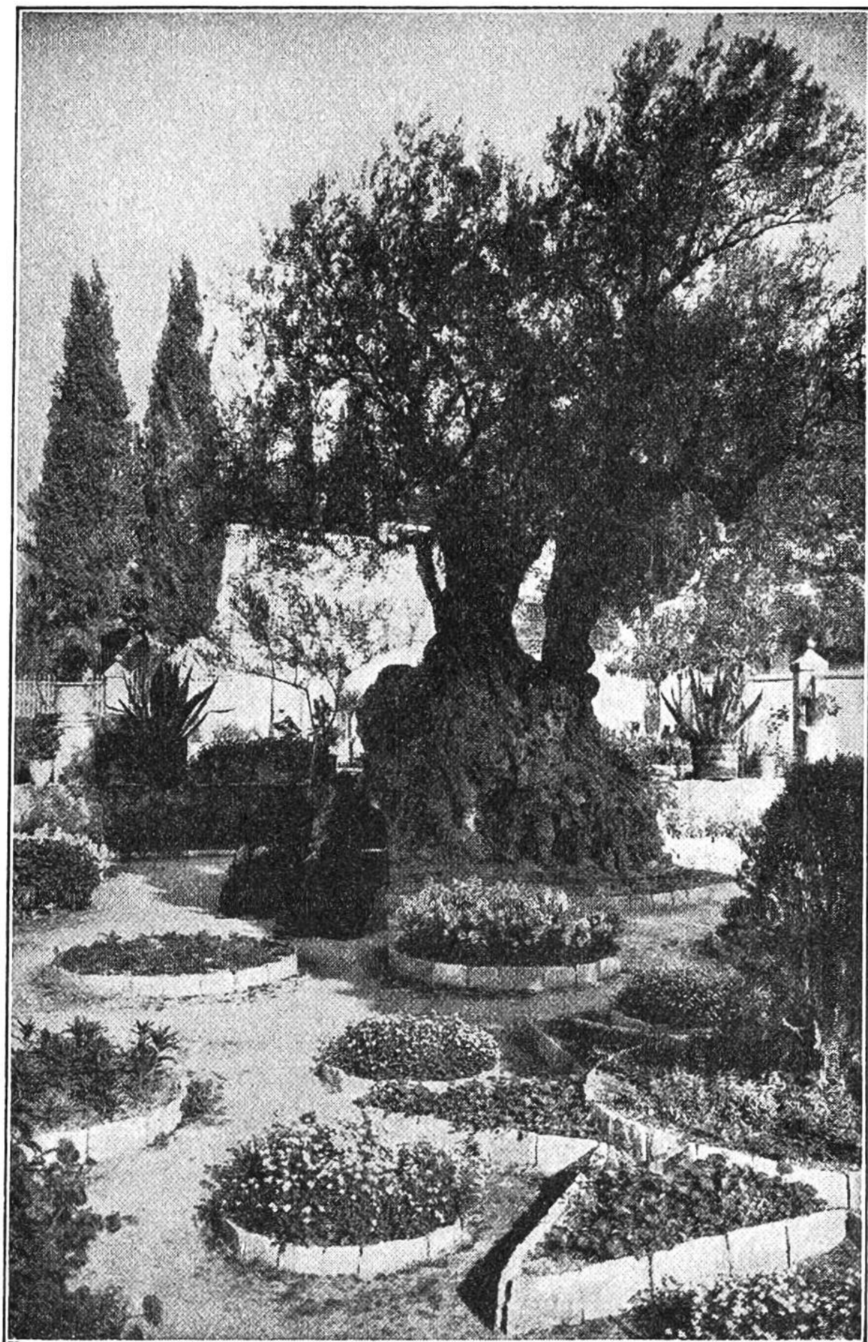
Der Garten Gethsemane, wo Jesus Christus in der Nacht vor seiner Gefangennahme ruhte.