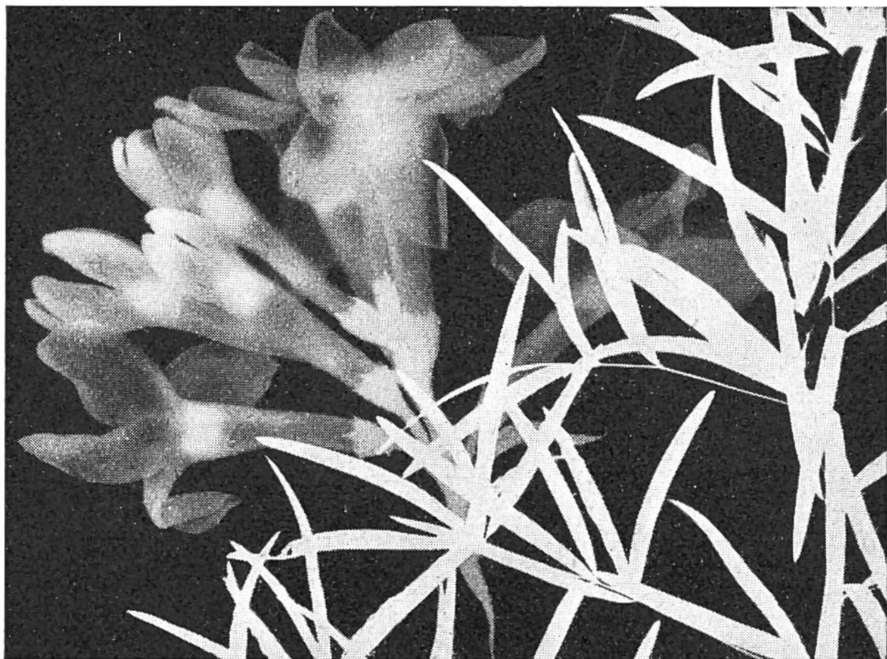
Photo ohne Kamera. Wichtig ist die schöne Anordnung der Pflanzen.

Papier legt man das Holzbrettchen und hält Glas und Brettchen durch die Wäscheklammern zusammen. Nun bringt man das Ganze (Glasseite gegen oben) ans Licht; aber besser nicht an die direkte Sonne. Wenn das entstehende Bild genügend gedunkelt ist, legt man es einige Minuten ins Fixierbad und lässt es dann während 2 Stunden in einem Wasserbad, das sich durch etwas zufließendes Wasser erneuert. Zum Schluss wird das Bild am Schatten zum Trocknen gelegt. Auf diese Weise kann man bei richtiger Wahl der Pflanzen und geschmackvoller Anordnung sehr hübsche Bilder erhalten.