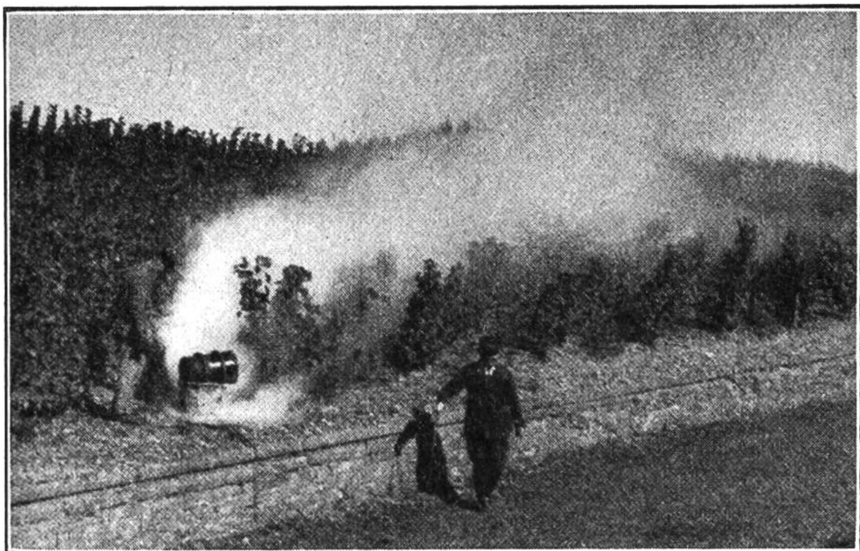
Frostbekämpfung im Weinberg durch Erzeugung von chemischen Nebeln. Die Nebelschwaden bedecken das Gelände und verhindern zu starke nächtliche Abkühlung.