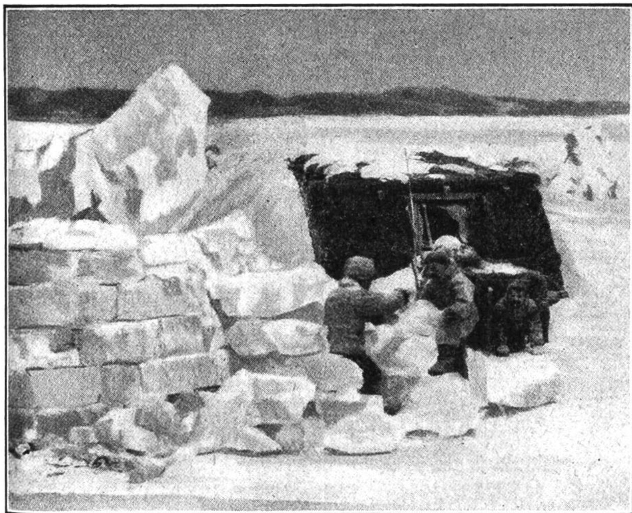
Neben der Sommerhütte bauen Eskimos eine wärmere Winterhütte aus Eisblöcken.

durch das Wasser gleiten, hört man kein Geräusch, weder von den Rudern noch vom Kiel, der das Wasser durchfurcht. Die auf treibenden Eisschollen sich sonnenden Seehunde wittern keine Gefahr; sie werden mit der selbstgefertigten Harpune oder neuerdings auch mit dem Gewehr erlegt. Die Eskimos könnten ohne Seehundsjagd kaum ihr Leben fristen. Sie verwenden das Fleisch, die Felle und den Tran der Seehunde. Zur Herstellung von Gebrauchsgegenständen dienen Därme, Sehnen und Knochen. Allerdings erlegen die Eskimos auch Walrosse, Eisbären, Wale und Polarfüchse, zudem fangen sie Fische, aber die Jagd auf Seehunde ist bei weitem am ergiebigsten. Die Eskimos verkaufen auch Seehundsfelle, die dann in verschiedener Art verarbeitet werden; dem Skifahrer sind sie nicht unbekannt.