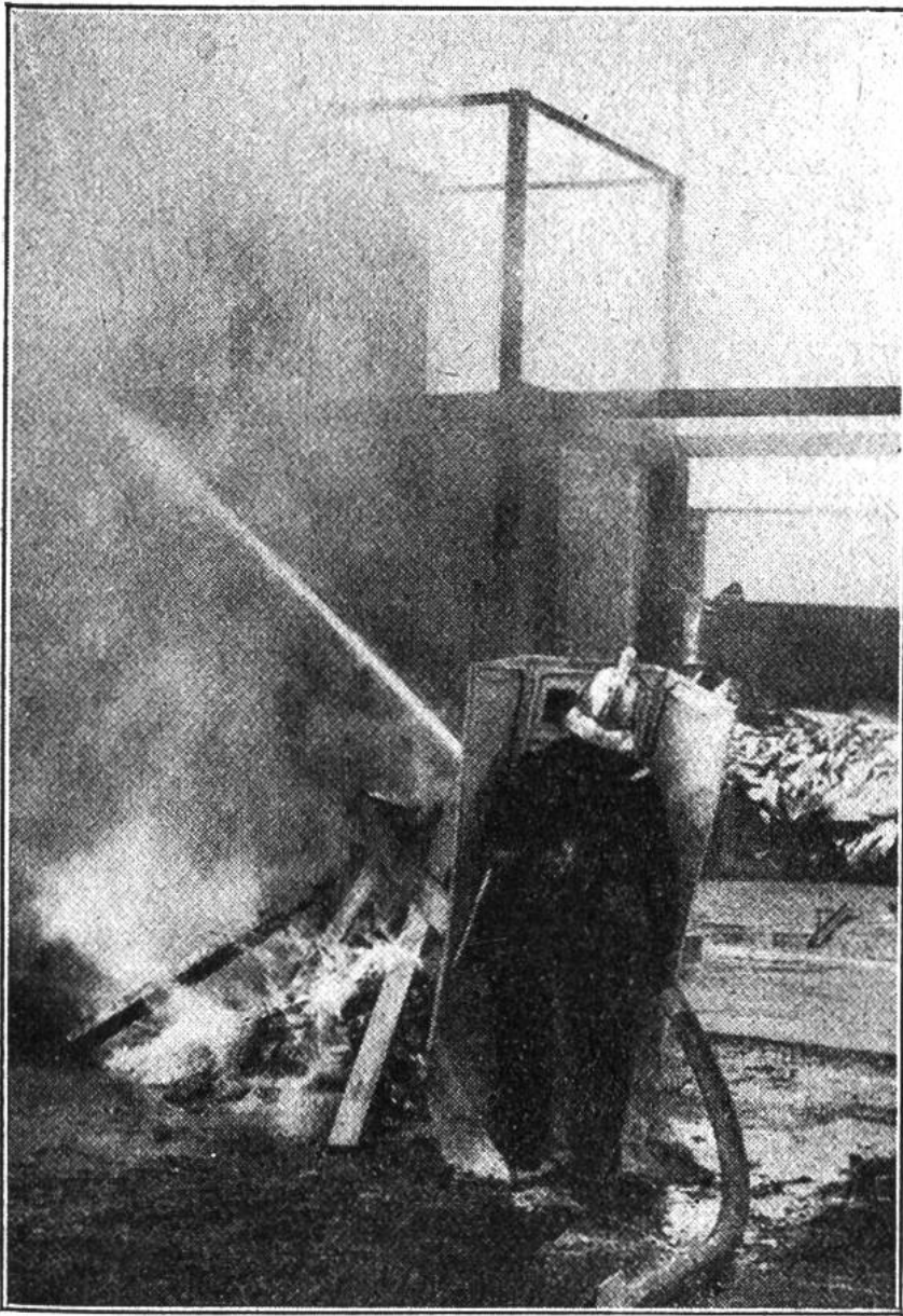
Feuerwehrmann mit Asbestschild. Eine kleine Scheibe aus Glimmer gibt freien Ausblick.

licher Farbe. Bei der Gewinnung von Asbest werden Asbestblöcke von ihrer Lagerstätte im Boden weggesprengt, in einer Fabrik durch Reissmaschinen zerteilt und durch Kochen mit Wasser in die faserigen Teile zerlegt.