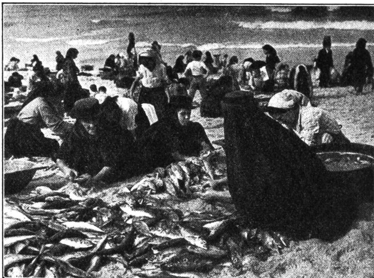
Ein malerisches Bild: Das Frauenvolk ist eifrig mit dem Ausnehmen und Reinigen der Fische beschäftigt.

Die Fischereifahrzeuge und die Fangmethoden dieser Fischersleute muten noch sehr altertümlich an. Natürlich gibt es auch schon Fischereidampfer und moderne Schlepp- und Schwimmnetze, aber die Fischerboote mit Segel- oder Ruderantrieb und die überlieferten einfachen Fangweisen überwiegen doch bei weitem. Die in der Regel winzigen Fischerkähne haben charakteristische, uralte Formen, häufig eine Halbmondform. Die Schiffswände sind oft mit leuchtenden Malereien versehen, denen gewöhnlich eine religiöse oder abergläubische Vorstellung zugrunde liegt. Wo nicht gerade ein natürlicher Hafen vorhanden ist, werden die Boote nach Benutzung einfach auf den Strand gezogen.