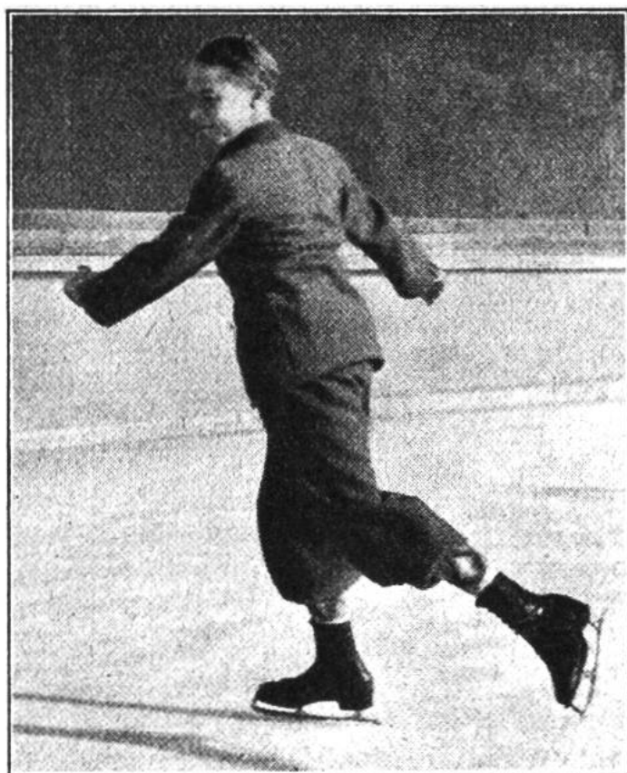
Anfangstellung des Bogens rechts-vorwärts-einwärts.

men, heisst es vor allem, einige Grundfiguren gut zu lernen, diese immer genau zu fahren und sie viel zu üben. Zu den Grundfiguren gehören: Bogenachter, Schlangenbogen, Dreier und Doppeldreier. Die nachfolgenden Ratschläge sollen euch das Erlernen einiger dieser Figuren erleichtern helfen. Später werden wir weiteres über den Kunst-Eislauf berichten.