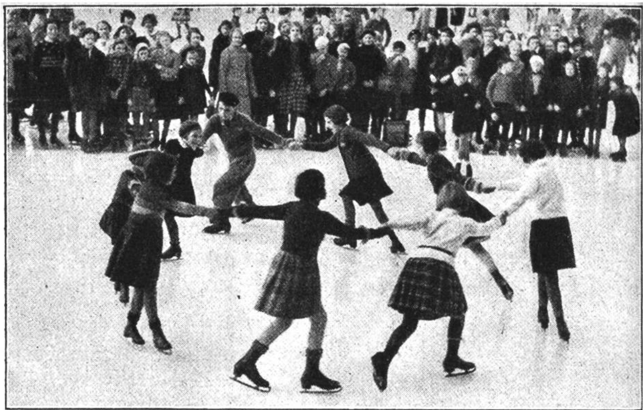
Vorwärtsübersetzen im Kreis, eine gute Vorübung für das Bogenfahren.