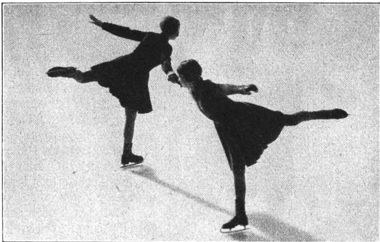
Die kleine Mühle („Moulinet“). Sobald der Vorwärtsbogen „sitzt“, lassen sich schon nette Figuren zu zweit fahren.