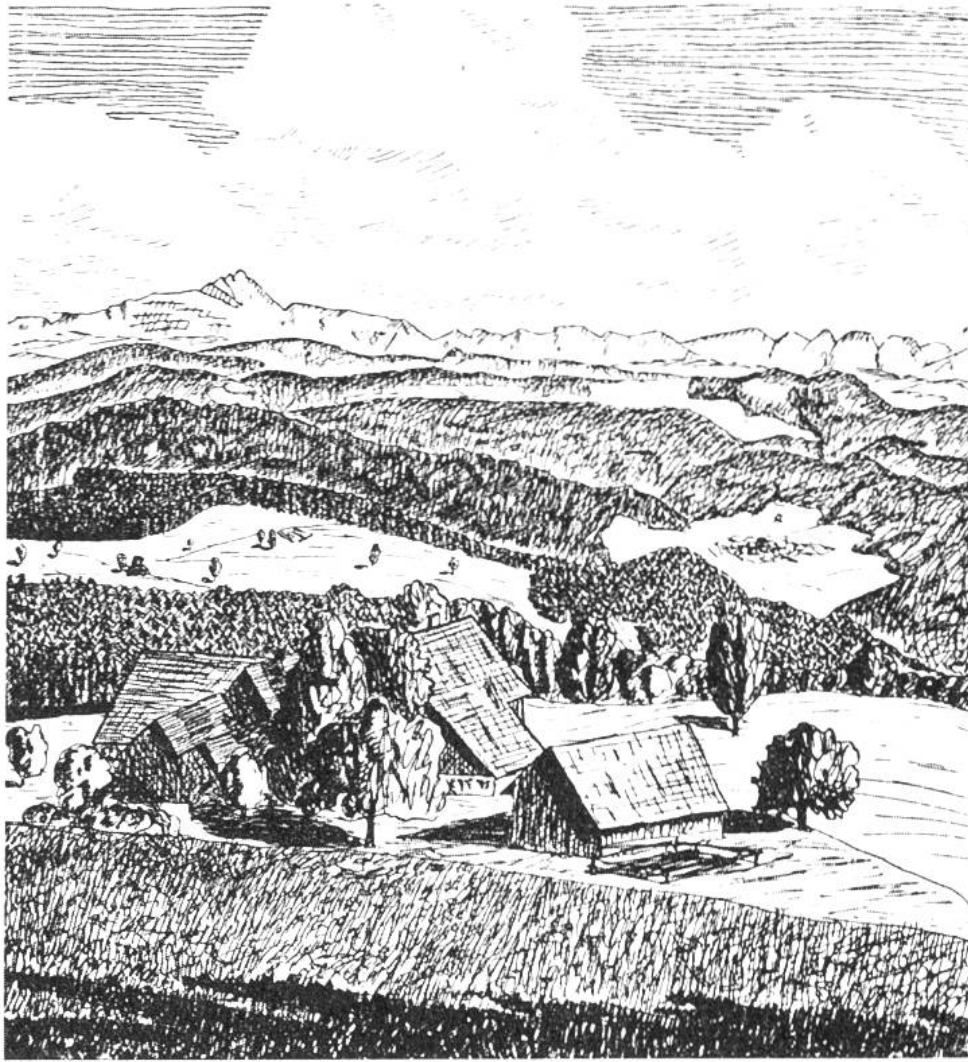
„Ausblick vom Haselberg (Thurgau) gegen Säntis und Churfürsten“, nach Natur gezeichnet von Georg Bosshardt (15 Jahre), Guntershausen.