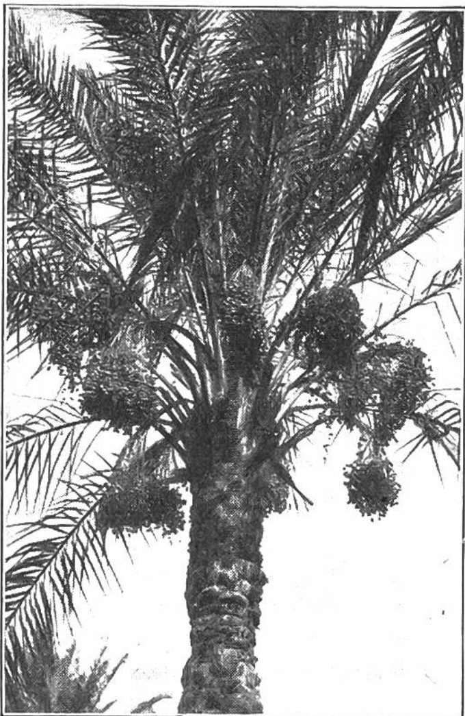
Büschel der zuckersüssen, nahrhaften Datteln in der Krone der hohen Palme.

danischen Festen Verwendung und ergeben Besen und Bürsten; die Knospen werden als „Palmkohl“ verspeist; die Fasern, welche den Stamm umkleiden, werden zu Körben und Matten geflochten. Kein Wunder also, dass der Dattelpalme, wo sie gedeiht, auf den Kanarischen Inseln, in Marokko und Tunesien, in den Oasen der Sahara, in Ägypten, Arabien, Südwestasien, überall die sorglichste Pflege zuteil wird. Dattelpalmen kann