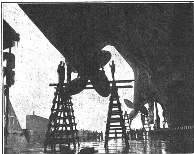
Ein stolzer Ozeanriese wird im Dock gemustert und aufgefrischt. Das Bild zeigt die beiden rechtseitigen Antriebsschrauben und gibt einen Begriff von ihrer Grösse.

es sich dann leicht fangen. Italiener ziehen mit gezähmten Tieren von Dorf zu Dorf und zeigen dort den kleinen „Aufbrauser“ für Geld. Weil er so leicht erregbar ist, muss er viele Neckereien erdulden.