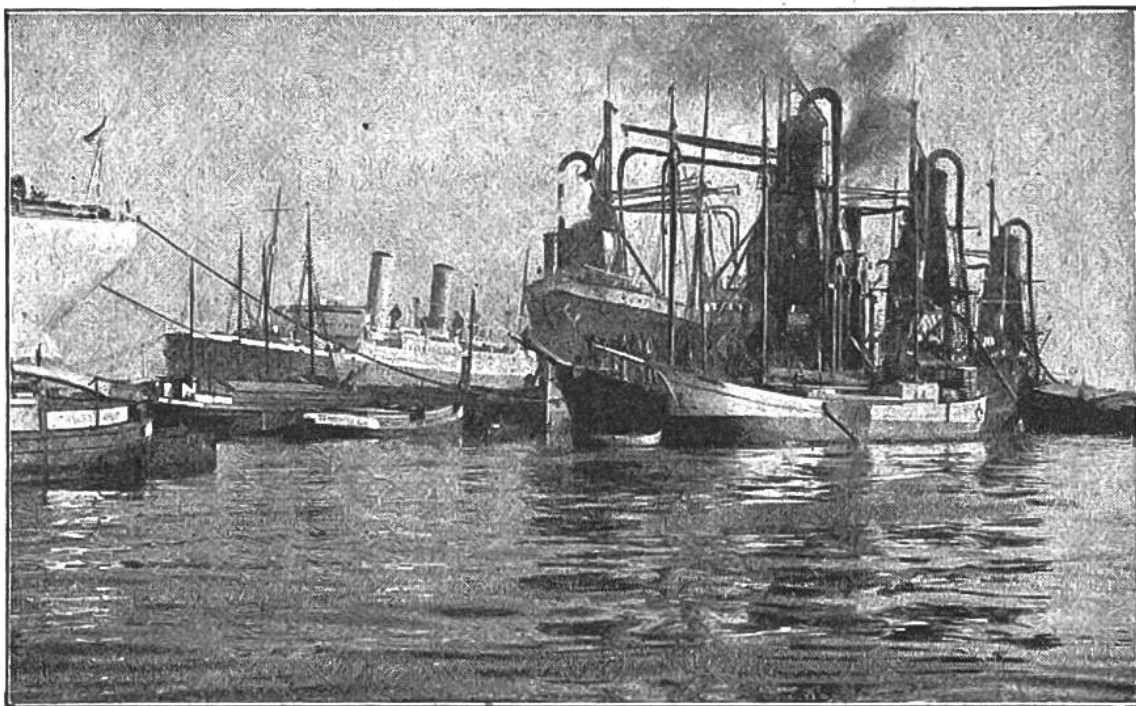
Getreide wird aus den Frachtdampfern mittels Saugrohren verladen. Bild aus dem Hamburger Hafen.