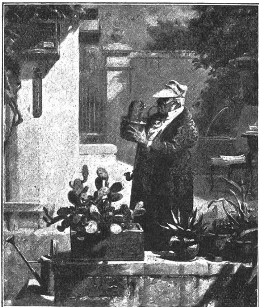
Der Kakteen- freund, von Karl Spitzweg (1808 bis 1885).

dienlicher. Sie bieten einen gewissen Schutz gegen Tiere, denen die saftreichen Gewächse in den Gebieten, wo der Durst herrscht, wohl munden würden. Zwar suchen Esel und Rind die Kakteen zu entwurzeln, um von der unbewehrten Seite an die saftigen Gewebe zu gelangen. Oder sie versuchen durch Hufschläge die Pflanze zu spalten, tragen aber oft genug unangenehme Verwundungen davon. Um die Kakteen als Viehfutter verwenden zu können und die Früchte (besonders der Feigenkakteen) zu geniessen, hat der Amerikaner aber auch stachellose Kakteen gezüchtet. Damit können weite, bisher öde Gebiete für die Landwirtschaft erschlossen werden.