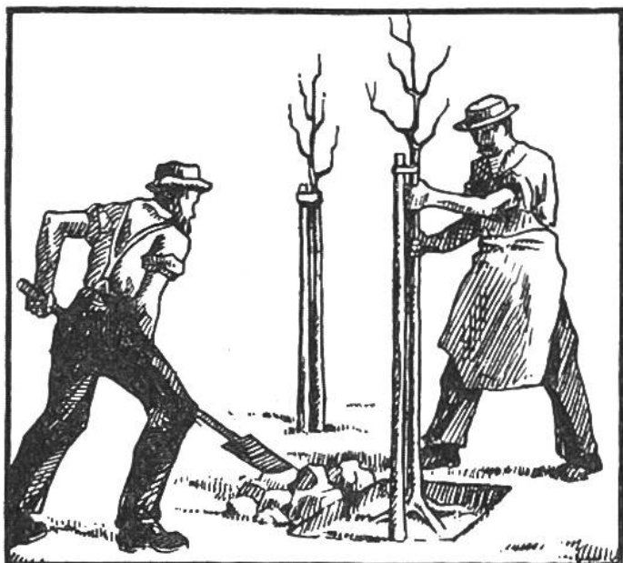
Pflanzen eines jungen Obstbaumes: der eine hält den Baum, der andere schaufelt die Erde zu den Wurzeln.

Der Obstbaum bedarf zu gutem Gedeihen Licht und namentlich Sonne, geeigneten Boden, zweckmässige Düngung und Pflege. Äpfel- und Birnzwergbäume, sogenannte Pyramiden, sollen wenigstens in 4—5 m Entfernung voneinander gepflanzt werden. (Hochstämme von Kernobstbäumen auf 10—20 m, solche von Steinobstbäumen, wie Pflaumen, Zwetschgen, auf 5—8 m.) Die Pflanzung geschieht vorteilhaft im Herbst bis zum Eintritt stärkerer Fröste, oder im Frühjahr vom März bis April. Wir heben ein Pflanzloch von wenigstens 1 m 2 Fläche aus, dessen Tiefe sich nach den Bodenverhältnissen richtet. Im Durchschnitt genügt eine Tiefe von 60 cm; bei gutem Boden kann man tiefer graben, in dürftigem Boden mit kiesigem Untergrund oder in nassem, schwerem Boden soll dagegen das