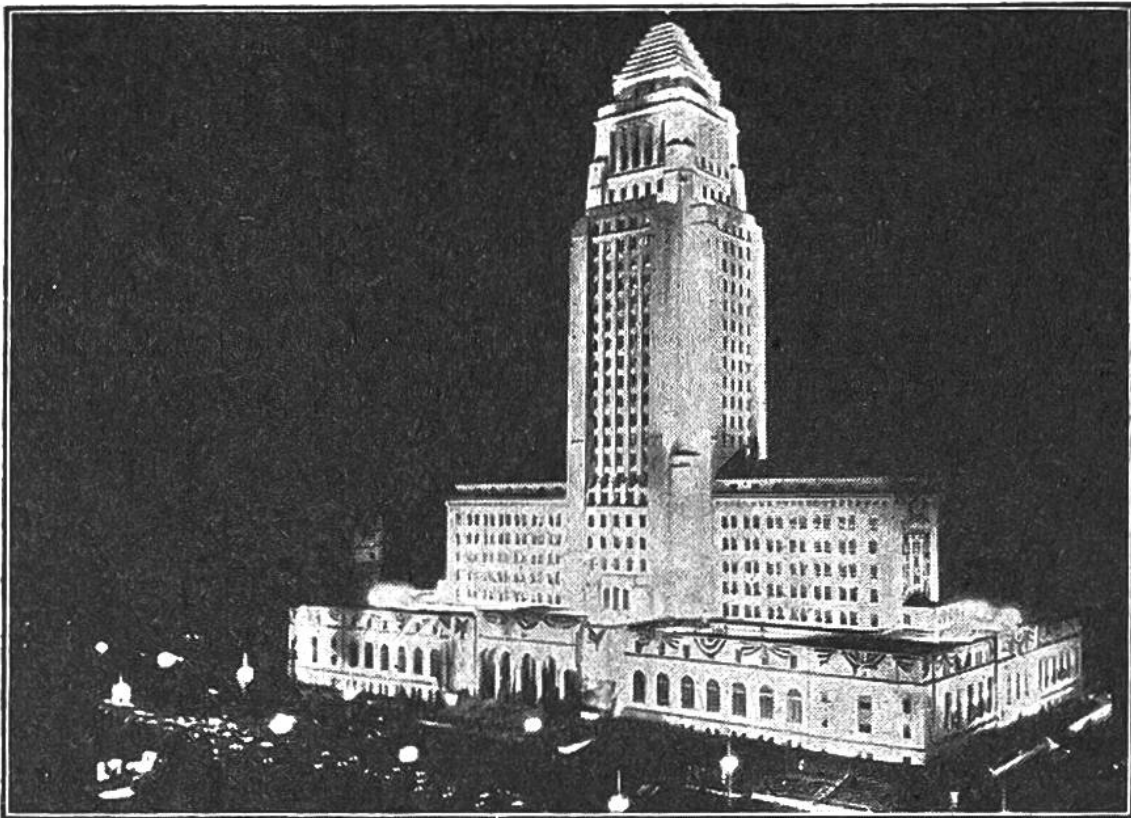
Lichter der Grösstadt: Das Rathaus von Los Angeles in Flutlichtbeleuchtung.

Beleuchtungen nicht geblendet, überreizt und mit der Zeit abgestumpft werde, suchen Architekten und Lichttechniker Ordnung und Mass in den Lichtreklameanlagen zu schaffen und die Leuchtkörper in Einklang mit dem gesamten Strassenbild zu bringen. Namentlich auch werden durchscheinende Leuchtkörper (Transparente) in die Hauswände eingebaut, weil am Tage mit