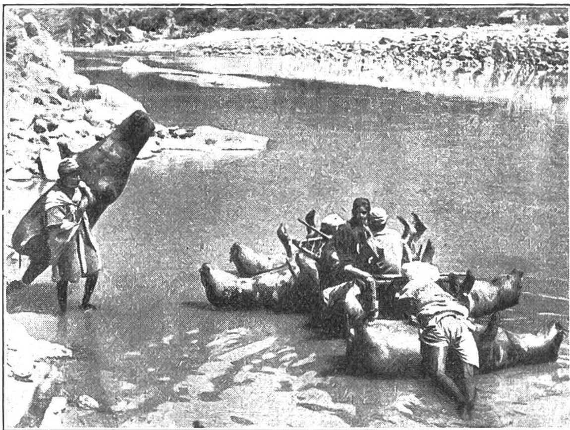
Inder des Himalaya befahren einen Fluss mit Flößen aus aufgeblasenen Ochsenhäuten.