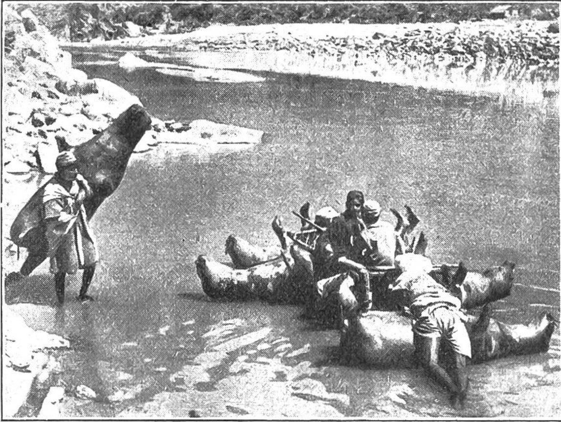
In der des Himalaya befahren einen Fluss mit Flößen aus aufgeblasenen Ochsenhäuten.