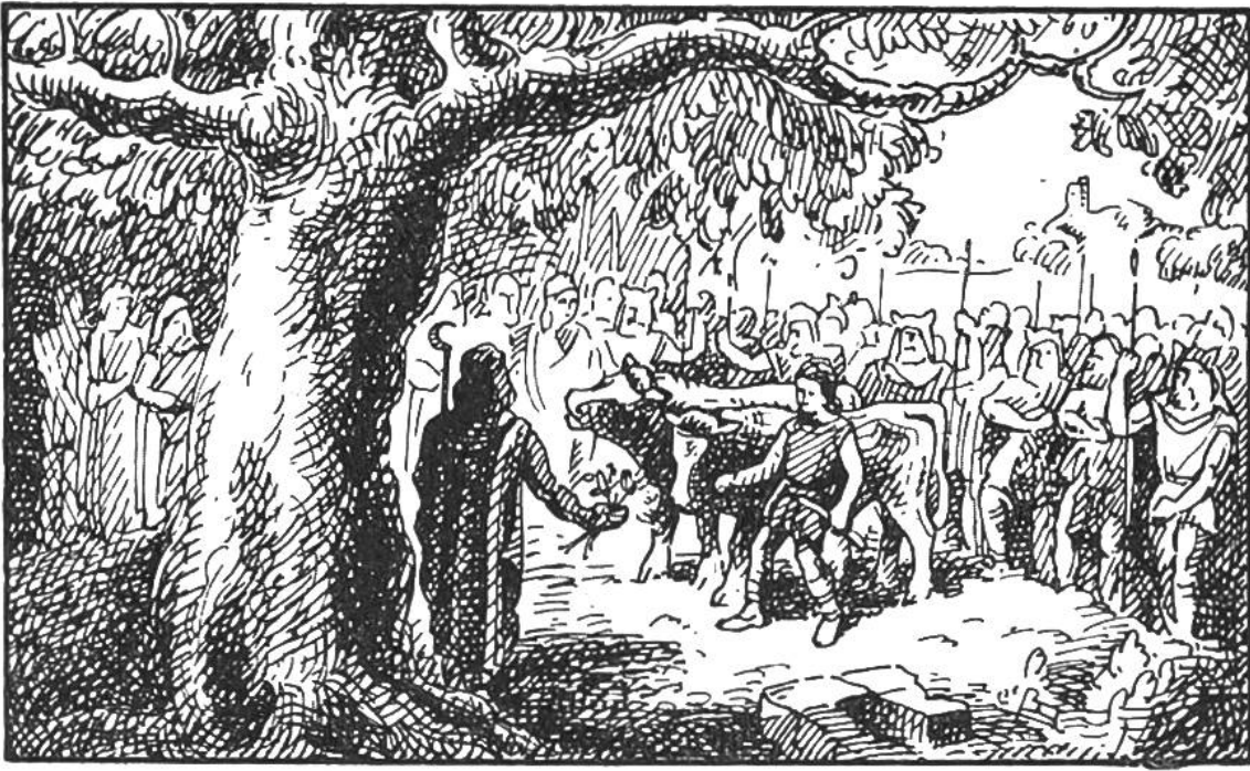
Keltischer Priester schmückt zum Sonnenwendfest die Opferstiere mit Mistelzweigen.

sei. Eine Sage erzählt, die Göttin Freia hätte sich von allen Gewächsen versprechen lassen, dem frohen Gotte der Sonne und des Sommers, „Balder“, kein Leid anzutun. Nur die Mistel wurde von Freia vergessen. Das vernahm der listige Loki. Er schnitt aus einem Mistelzweig einen Pfeil. Der Gott des Winters, der blinde Höder, traf damit den lichten Balder tödlich. So musste der Sommer dem Winter weichen.