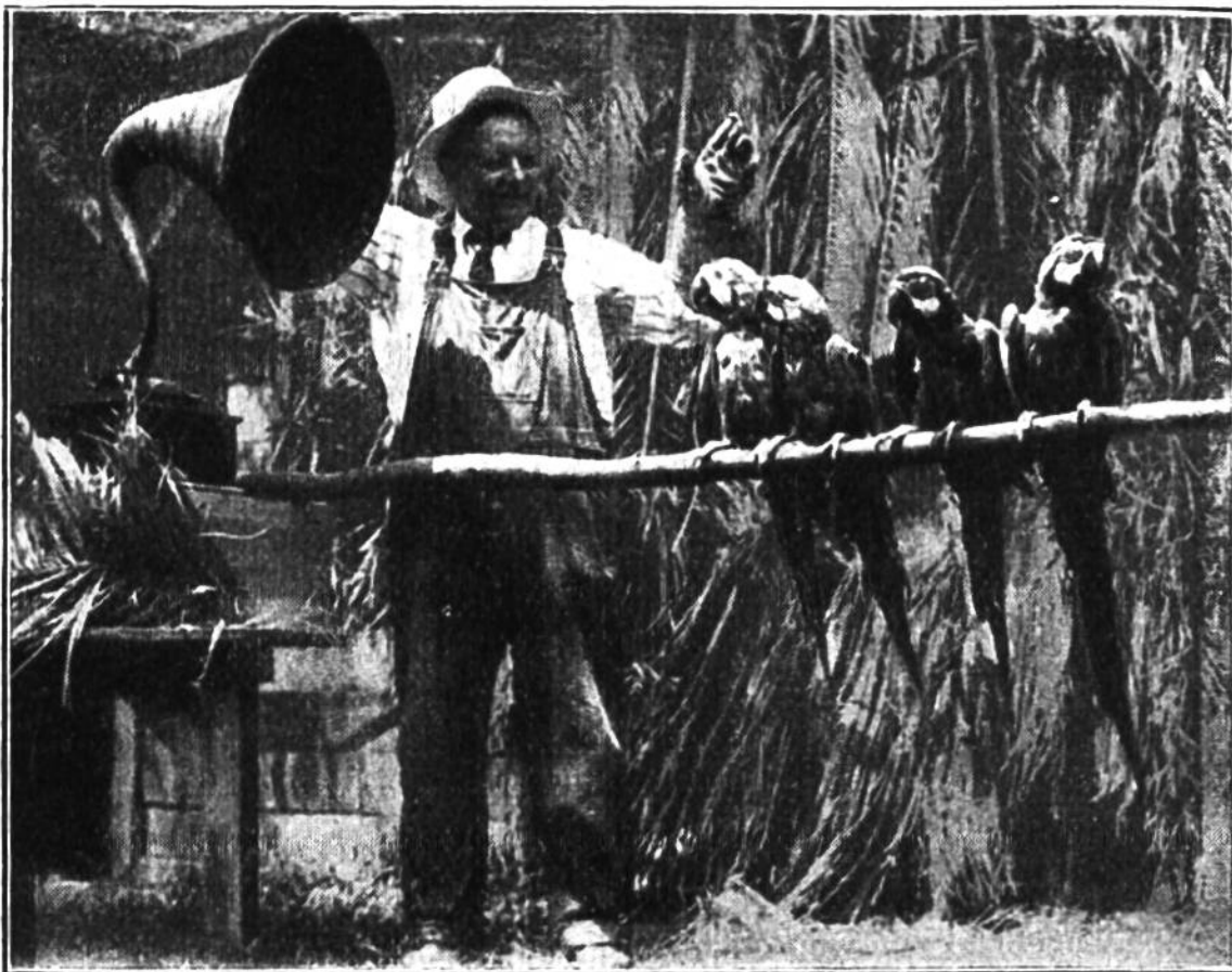
Der Lautsprecher als Sprachlehrer für Papageien.