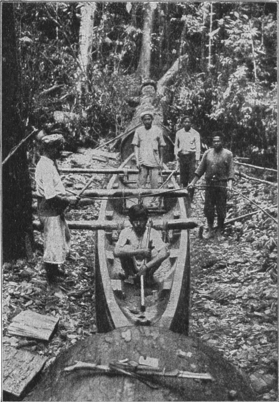
Dajakmänner zimmern im Urwald Borneos einen Einbaum. Das Boot ist noch nicht getrennt vom Baumstamm, aus dem es herausgehauen wird.