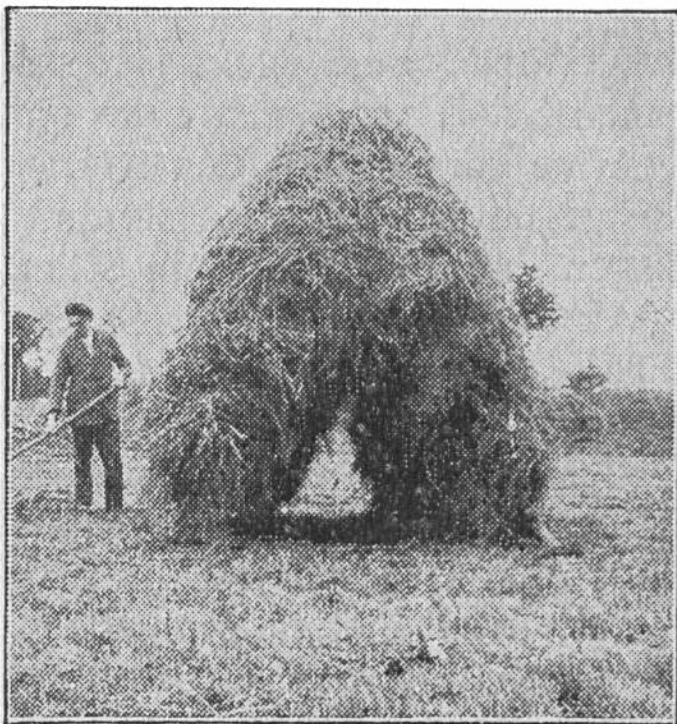
Das Heu wird aufgeladen.