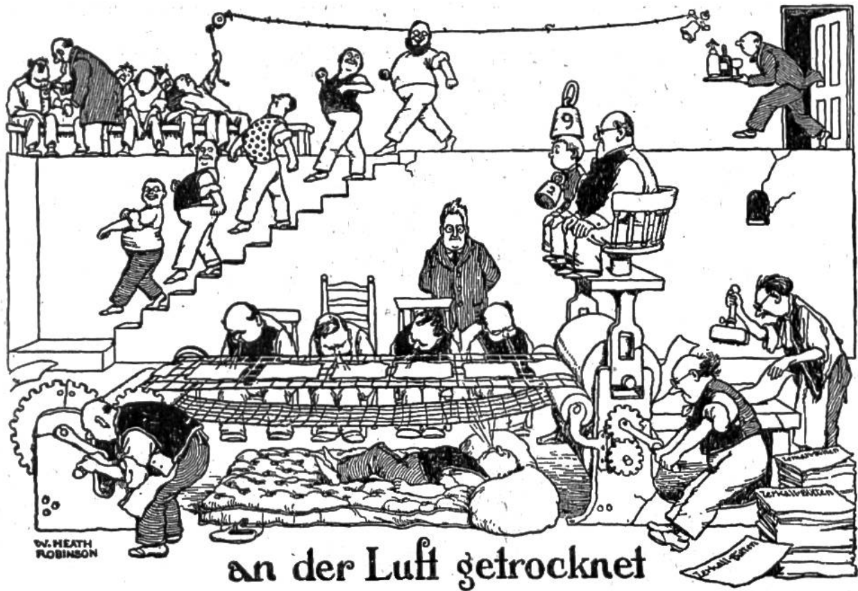
an der Luft getrocknet

das Papier unter dem Kessel, der den Tierleim absondert, vorbeigeführt wird. Auch muss man herzlich lachen, wenn man sieht, wie der Kessel durch Wachskerzen angefeuert wird.