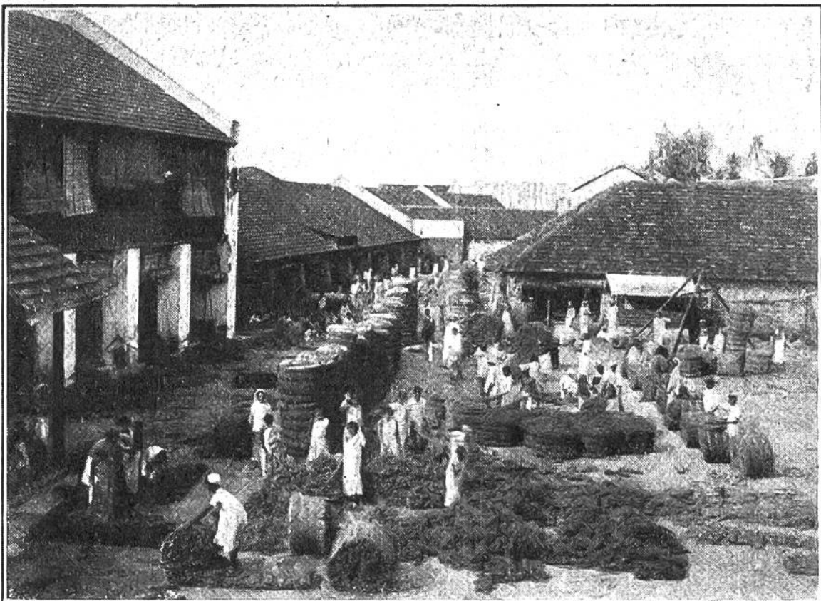
Sortieren der Kokosgarne in einer Faktorei. Die Garne werden zu Ballen gepreßt und dann in alle Welt verschickt.

Garne so weit her, daß dann auf mechanischen Webstühlen Teppiche, Läufer und Matten fabriziert werden können. Wiederum besondere Fabriken verarbeiten Kokosgarne zu Tauen und Treibriemen für Maschinen. So sind all diese nützlichen Dinge, vom Schöngemusterten Teppich bis zum einfachen Kokosfaserseil, das Werk der unerschöpflichen tropischen Natur und vieler fleißiger Menschenhände.