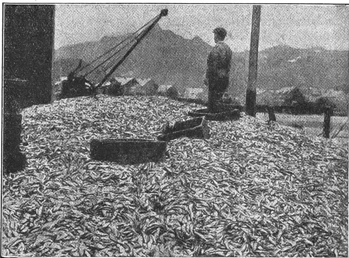
In einer norwegischen Hafenstadt zur Zeit der Heringszüge. — Ein Berg von Heringen.

Der Hering lebt in fast allen Meeren. In der Laichzeit wandert er in unermesslichen Scharen nach den Küstengebieten. Die Heringszüge sind oft mehrere Kilometer lang und ebenso breit; so dicht drängen sich Fische, daß Boote, die in einen