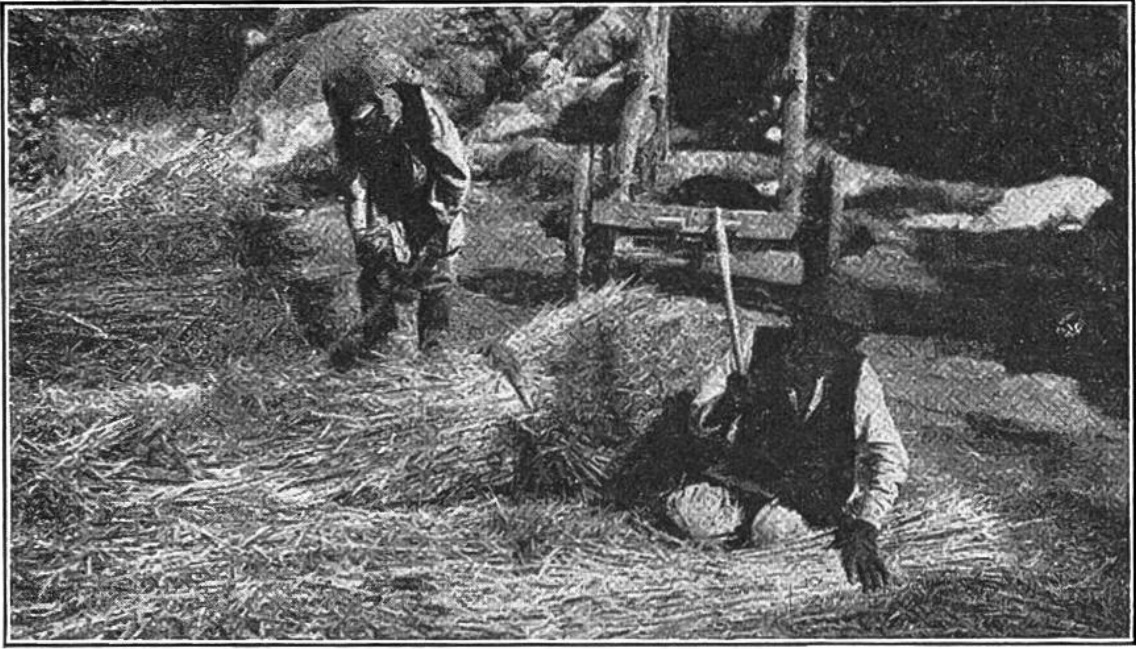
Dreschen kleiner Getreidemengen mit Knütteln.