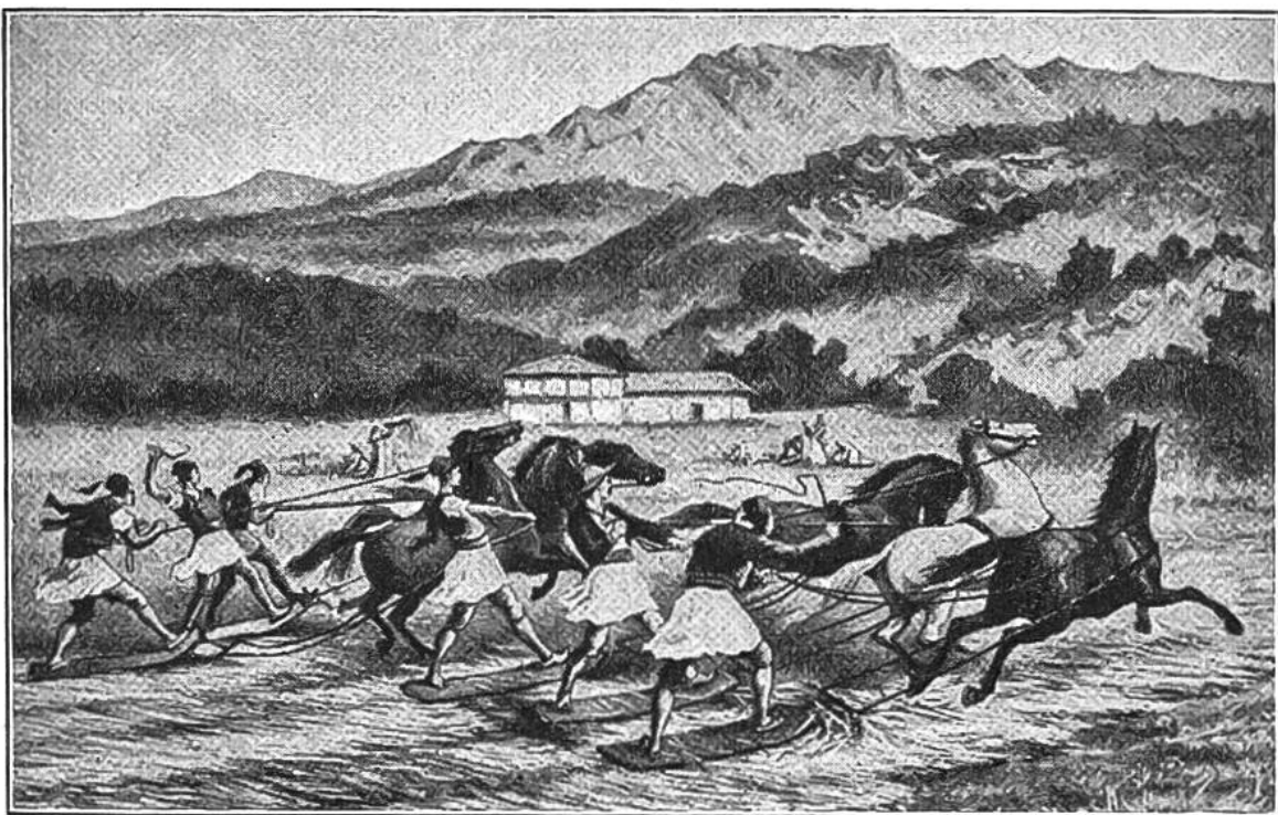
Dreschschlittengespanne auf der Insel Kreta.

Vor 200 Jahren wehrten sich in Bayern die Drescher dagegen; sie zertrümmerten, in Sorge um ihren Erwerb, manche Maschine. Die Dreschmaschinen lösen die Körner durch Schlag und Reibung. Rasch aneinander vorbeigehende Zapfen oder Leisten streifen die Ähren aus.