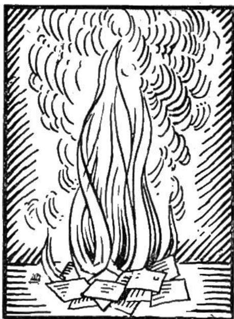
Das Schicksal von Ansichtskarten mit beleidigendem oder anstößigem Bild oder Text.