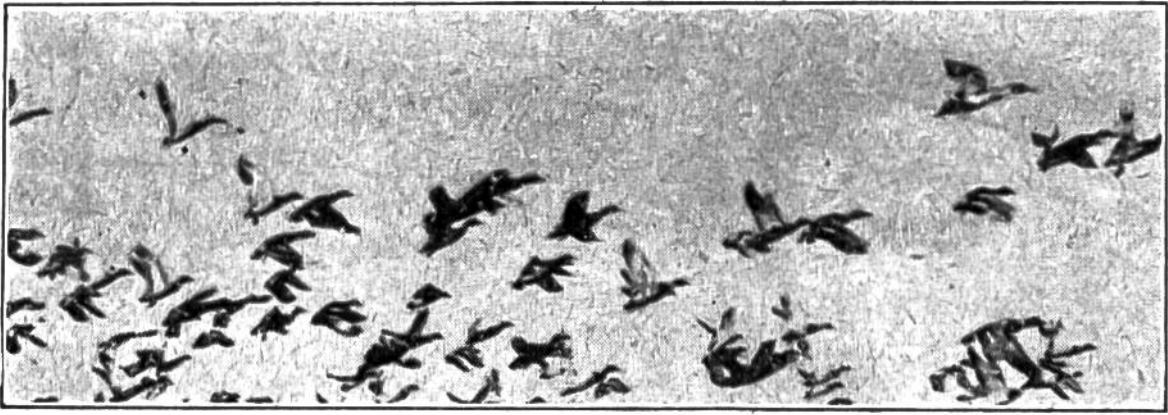
Zum Flug aufsteigende Wildenten.

Der Vogelmist hat nach und nach den Baum zum Absterben gebracht. Er sieht fast weiß aus und hebt sich um so mehr ab von dem ihn umgebenden Grün. Wenn die Jungen ausgeschlüpft sind, gibt es einen wahnsinnigen Lärm; man könnte glauben, die ganze Kolonie sei verrückt geworden. Das Geschrei ist nicht mit Worten zu beschreiben. Es erfüllt den Luftraum den ganzen Tag hindurch. Die Jungen sind unersättlich. Sie schreien, wenn die Alten fort sind, um Nahrung zu suchen, und sie schreien, was der Hals hält, wenn die Eltern mit etwas Greßbarem angeflogen kommen.