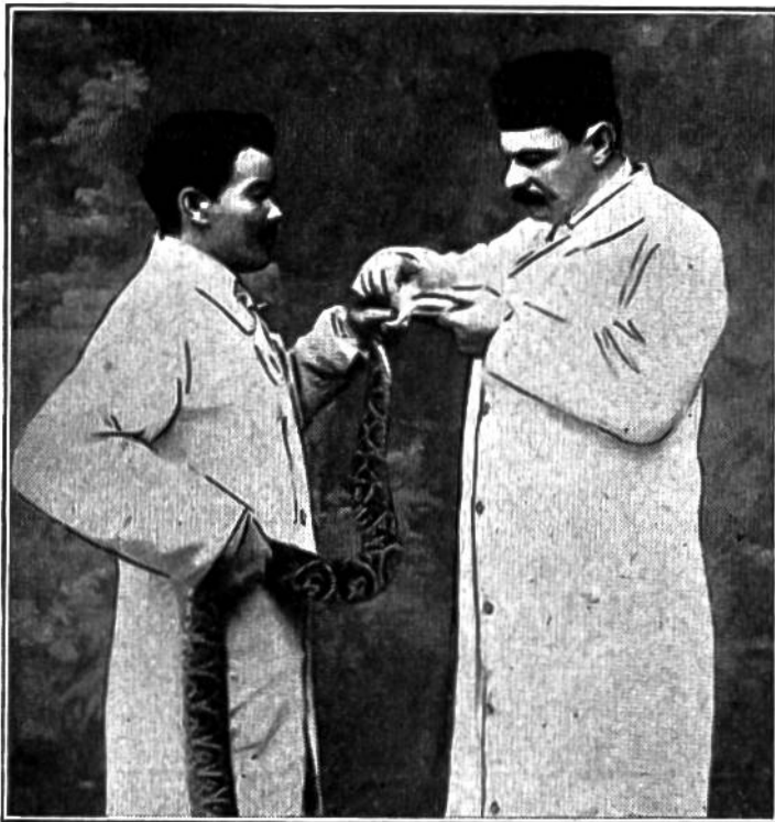
Eine gefährliche Operation. Gewinnung des Schlangengiftes.

Becherglas wird dann dem Tiere vorgehalten. Es heißt sofort danach und läßt einen oder zwei Tropfen seines Giftes im Becher zurück. Mit dem in Milchzucker gelösten Gift werden Pferde oder Esel geimpft. Die Dosis wird nach und nach erhöht. Im Impftier bildet sich ein Gegengift, so daß es mit der Zeit unempfindlich (immun) gegen die Wirkungen des Schlangengiftes wird. Der Impfstoff