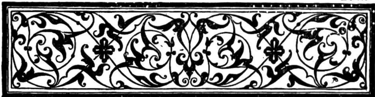
Ornament gezeichnet von Peter Flötner, Nürnberg, 1493—1546.