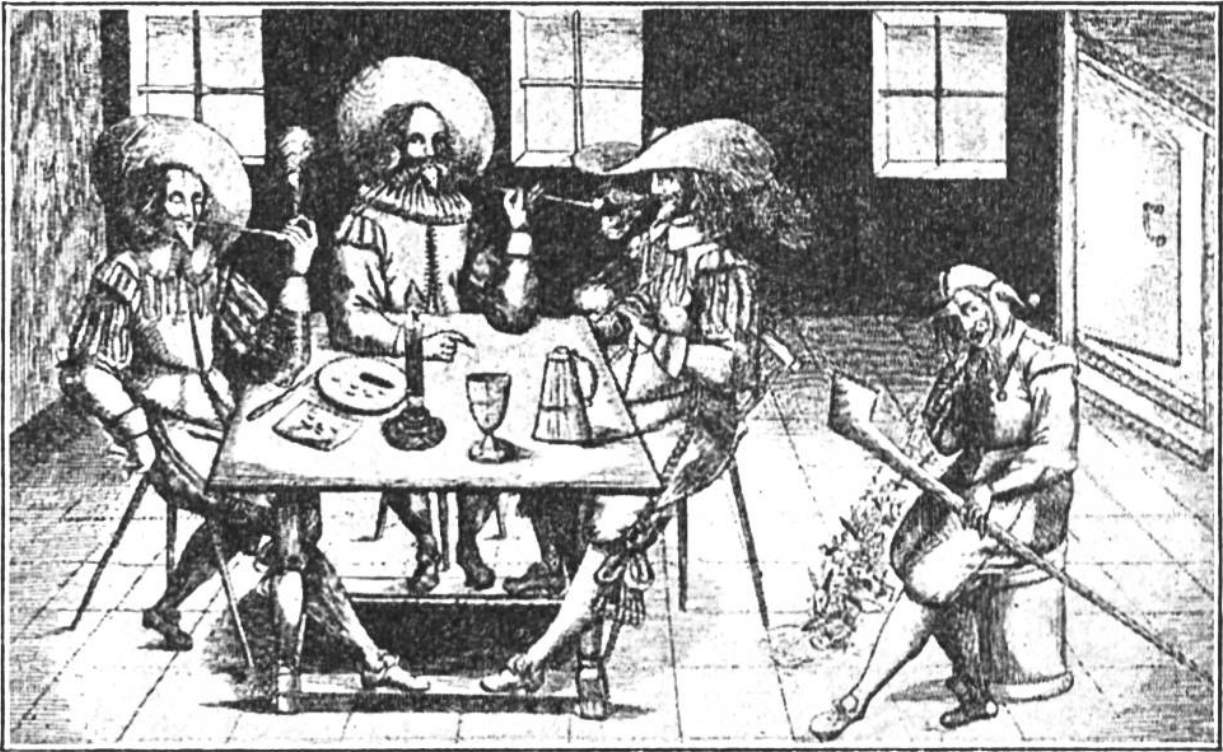
Ein Spottblatt aus dem 16. Jahrhundert über das damals aufgekom= mene Tabakrauchen (oder Tabaktrinken, wie man zu jener Zeit sagte).