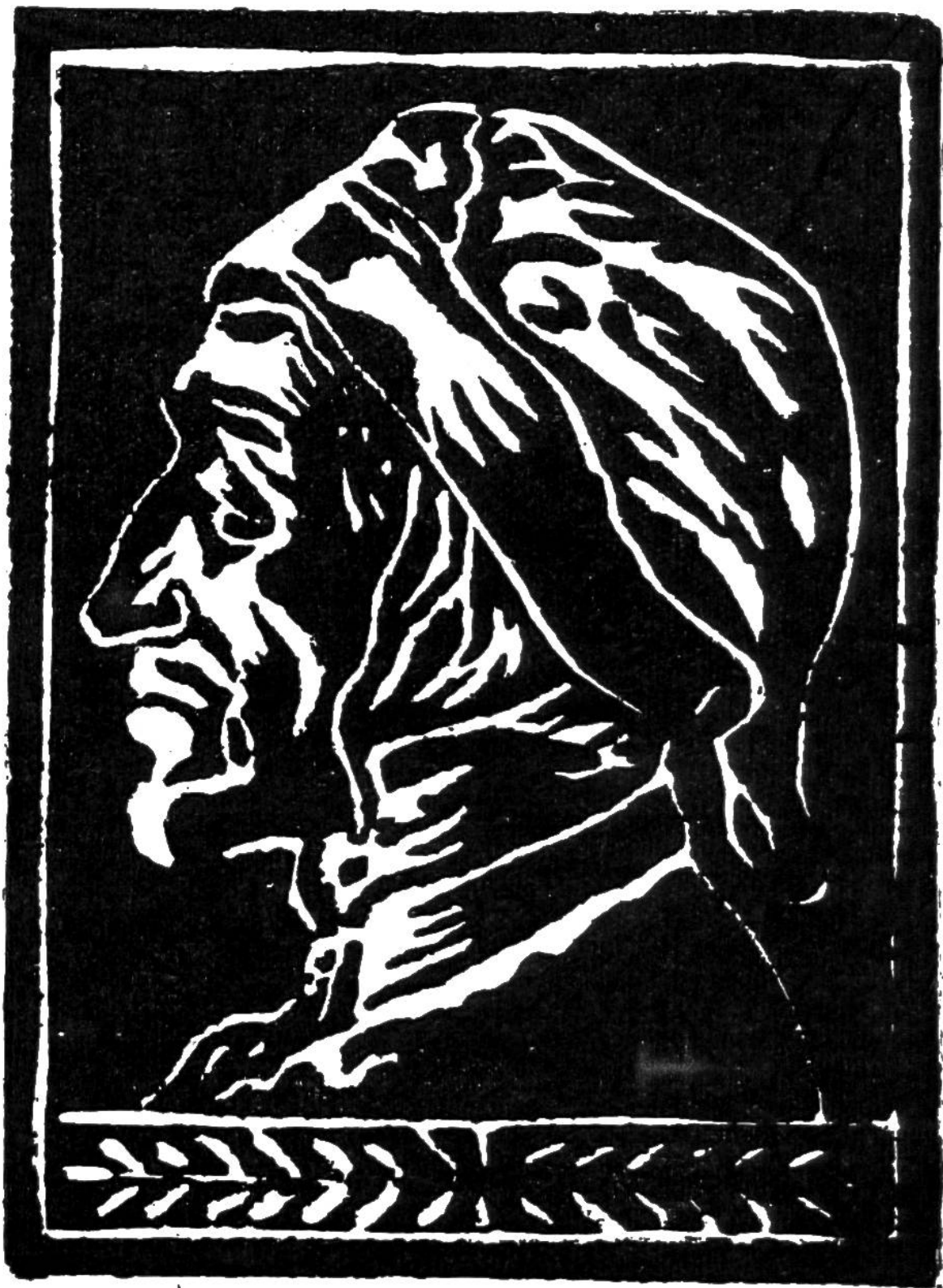
Dante Alighieri Linoleumschnitt