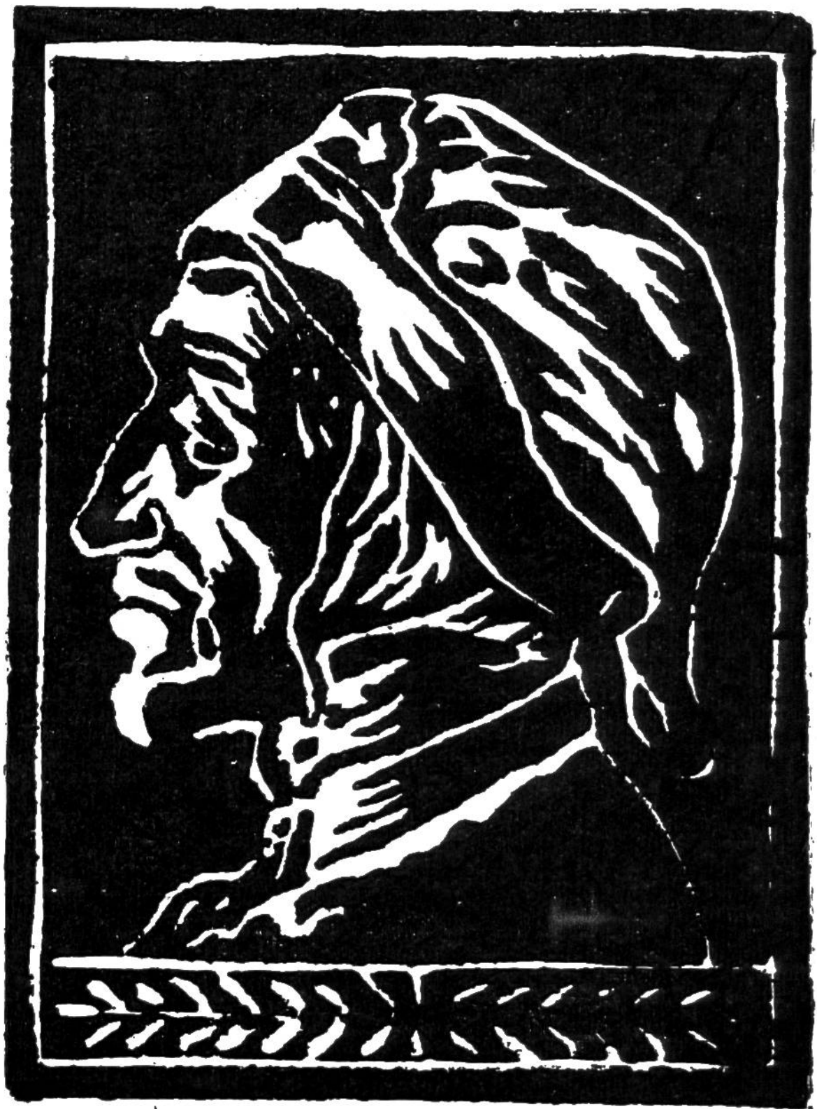
Dante Alighieri Linoleumschnitt