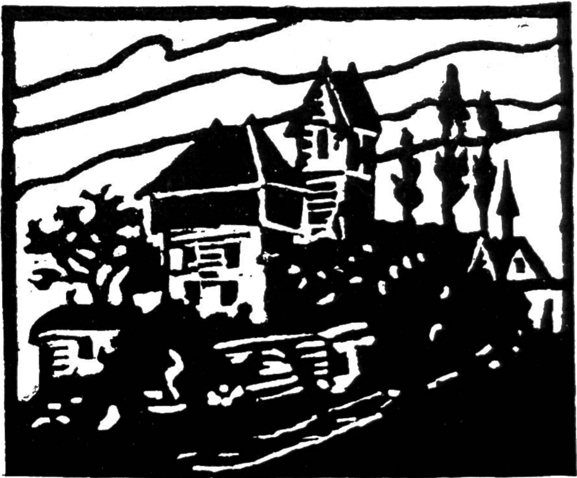
Alte Burg (Linoleumschnitt).

messer die Konturen nach und hebt alles, was nicht drucken soll, heraus, dabei beachtend, daß das Messer stets senkrecht oder schräg nach außen geführt wird, damit die stehbleibenden Formen nicht unterschritten werden. Damit der Grund nicht mitdrückt, muß er tief genug herausgehoben, jedoch nicht durchgeschnitten werden. Ein Kerbschnittmesser, schmale gerade und gebogene Schnitzseisen, ein Rilleisen und ein Stichel erleichtern das Schneiden sehr.