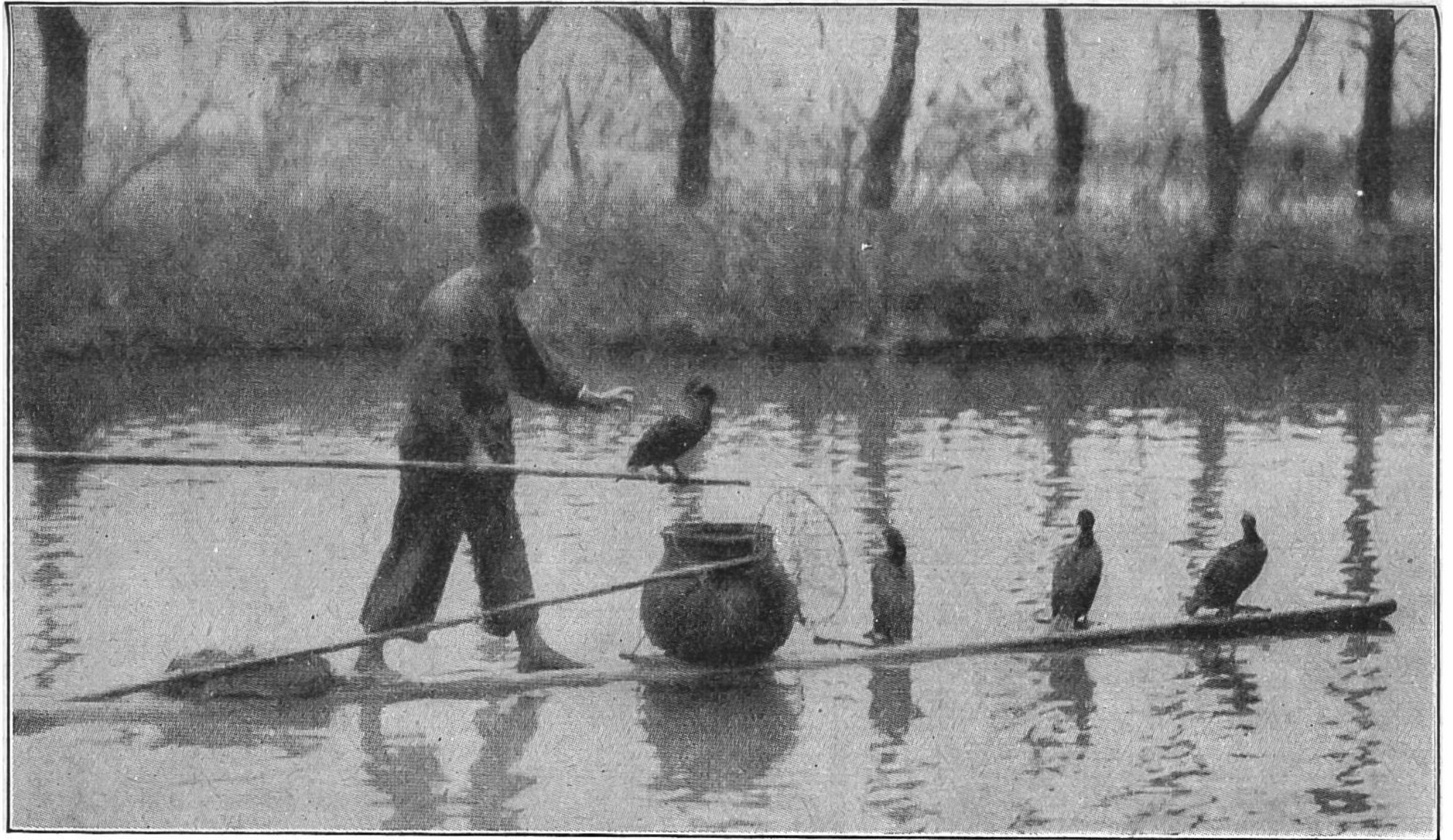
Der Fischer hebt den Kormoran, der einen Fisch gefangen hat, mit der Stange aus dem Wasser.