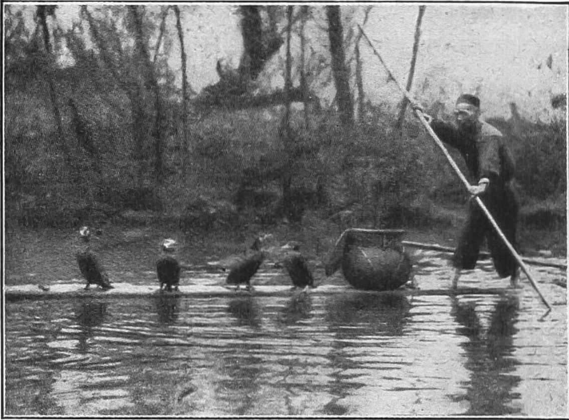
Chineser mit Kormoranen auf der Fahrt nach einer ergiebigen Fischstelle.