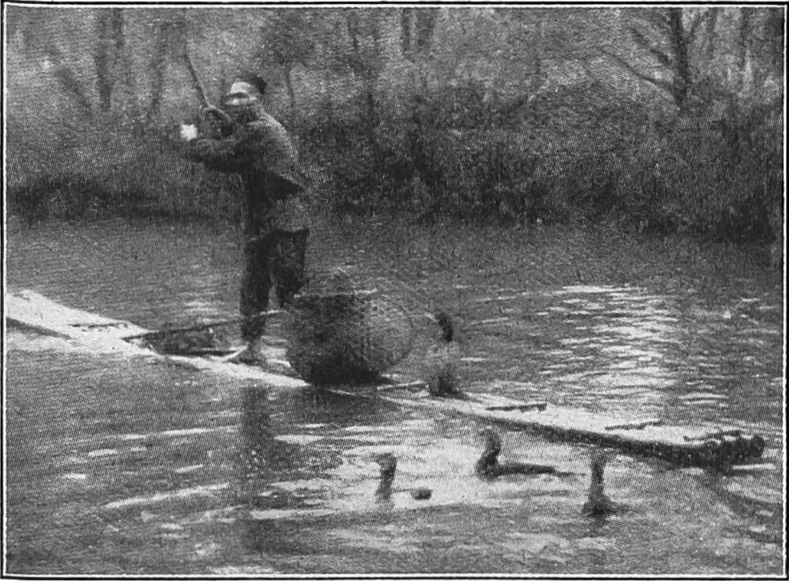
Die Kormorane bei der Arbeit.

ein Ring um den Hals gelegt, der ihn verhindert, die Beute herunterzuschlucken. Ein Orientreisender gibt folgende Beschreibung von einem Fischfang mit Kormoranen, dem er beiwohnte: