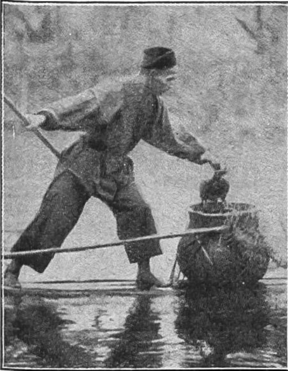
Der Kormoran wird veranlaßt, den Fisch in den Korb zu werfen.