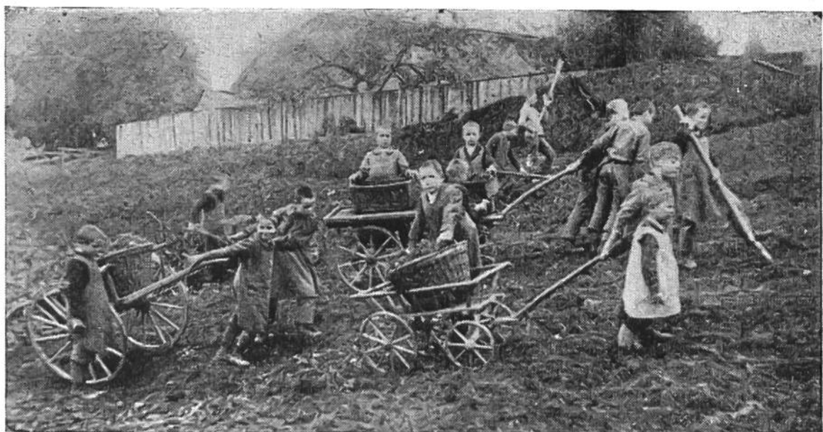
Blinde Knaben bei eifriger Feldarbeit.

Gruppe folgt, ist ganz blind. Er tummelt sich aber nahezu so sicher und munter wie ein Sehender auf seiner Bahn, wenn er sich in derselben einmal auskennt. Der auf eigene Rechnung mit dem Schlitten zu Tal steuernde Junge sieht noch etwas. Aber auch er muß sich mehr auf seine gute Orientierungsgabe und seinen „Sernsinn“ verlassen, als auf seine Augen. — Schlitteln und Schlittschuhlaufen sind bevorzugte Wintervergnügen der blinden Jugend. — Eine rabiate Schneeballschlacht, bei der das lebhafteste Schwätzen und Lachen der Gegenpartei dem „Kämpfenden“ immer wieder das Ziel an gibt, wird bei jeder günstigen Gelegenheit veranstaltet. — Oft ersteht ein recht gelungener Schneemann unter der geschickten Hand des Blinden.