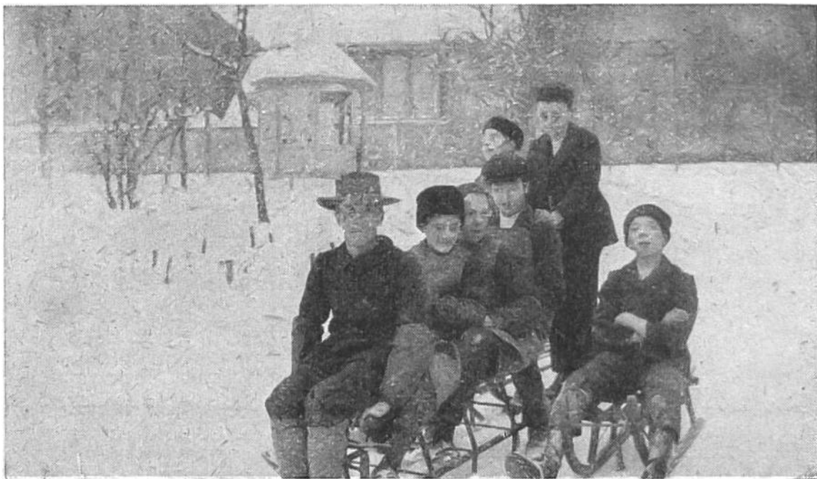
Blinde Knaben bei fröhlichem Wintersport