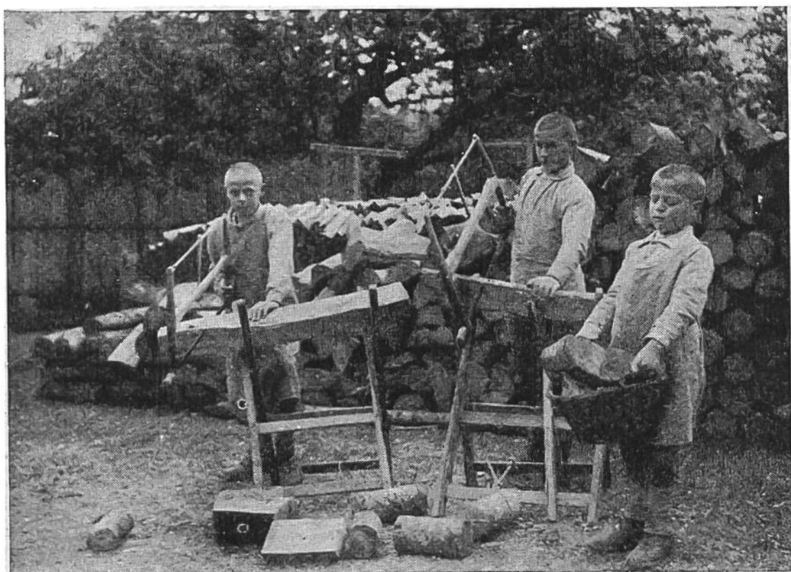
Blinde Knaben beim Zerfeleinern von Holz, fie erweisen ſich dabei geſchickter als viele Sehende.

Hier ſehen wir Knaben beim Zerfeleinern von Holz. Das Zerſägen der Spälten gilt auch bei uns nicht als eine beſonders große, wohl aber als eine geſundheitlich unſchätzbar wertvolle „Kunſt“. Etwas heißer iſt dann das Holzſpalten. Aber ſchon die größeren Schulknaben bringen es in dieſer Handierung zu einer erſtaunlichen Sicherheit und Gewandtheit. Verletzungen kommen dabei faſt nie vor.