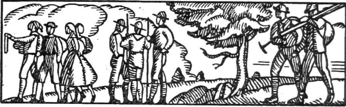
Wanderer und Pfadfinder.