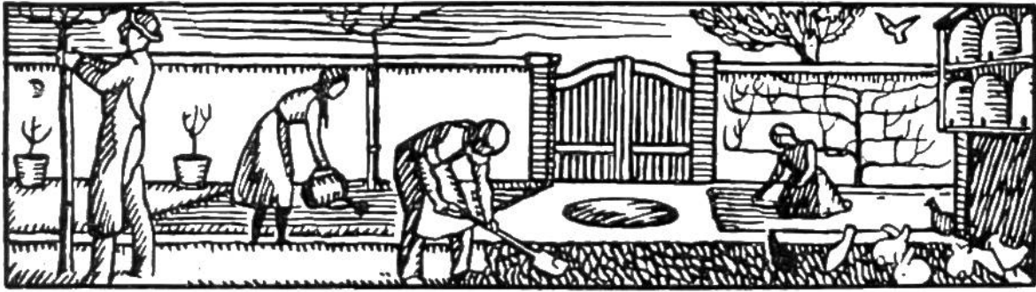
Hauswirtschaft und Garten.