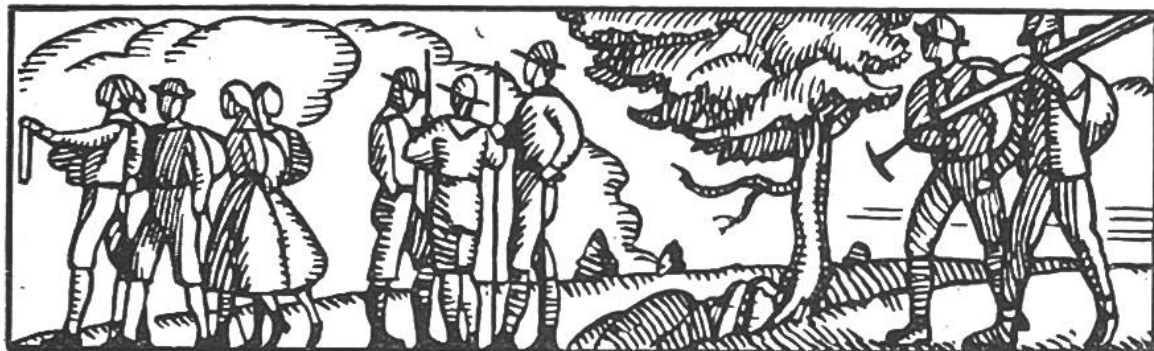
Wanderer und Pfadfinder.