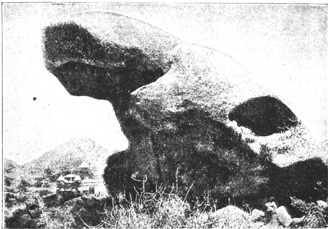
„Krötenfels“ auf dem heiligen Berg Abu in Indien.