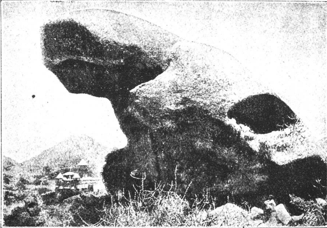
„Krötenfels“ auf dem heiligen Berg Abu in Indien.