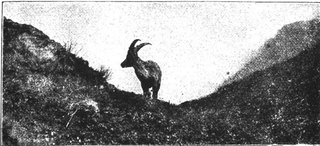
Frei & Co., St. Gallen.