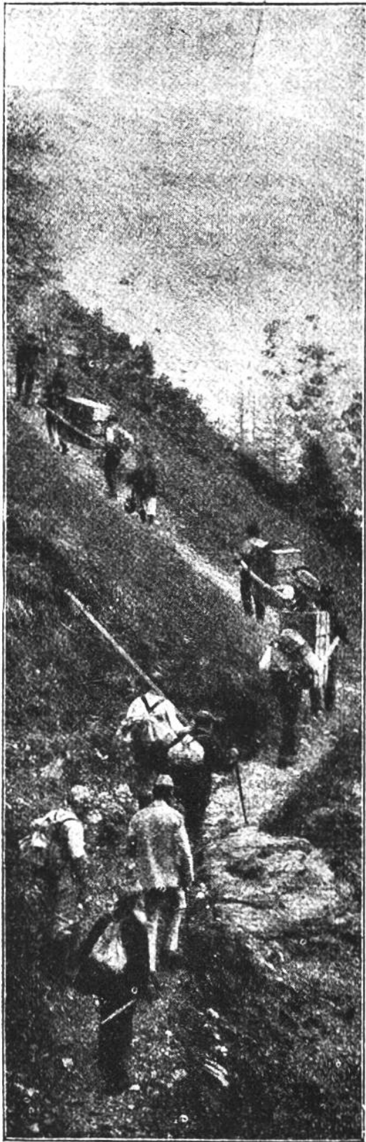
Frei & Co., St. Gallen.