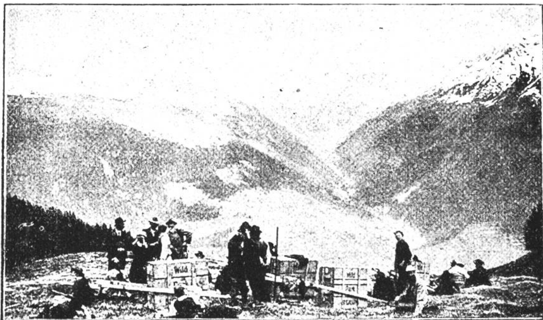
Frei & Co., St. Gallen.