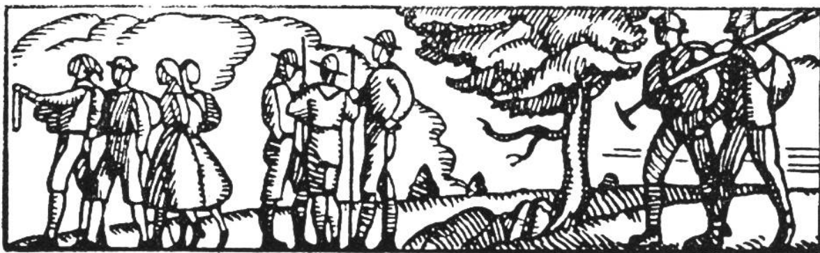
Wanderer und Pfadfinder.