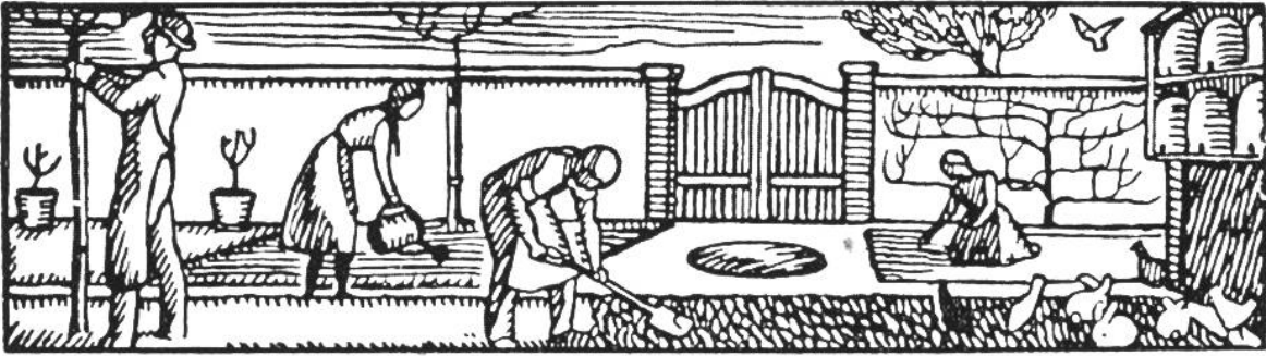
Hauswirtschaft und Garten.