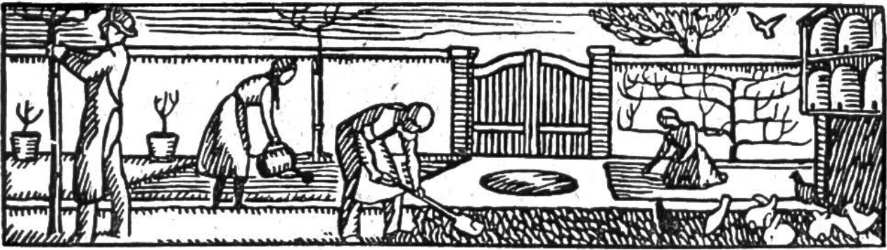
Hauswirtschaft und Garten.

Schutzgelegenheiten für die Vögel zu erhalten, soweit es ohne Beeinträchtigung des kulturfähigen Bodens geschehen kann. Sie sorgt z. B. für das Aushängen von Nisthöhlen, Unterhaltung von natürlichen und künstlichen Vogelschutzgehölzen und Fütterung der freilebenden Vögel während der Winterszeit. Durch Schriften und Vorträge will sie auch weitere Bevölkerungskreise für ihre Bestrebungen gewinnen. Durch Schonung der Vögel, die sich ja vielfach von schädlichen Insekten und Nagetieren ernähren, fördert sie die Land- und Forstwirtschaft und bewahrt Feld und Wald vor allzu starker Verödung. Sie hofft dabei, dass auch die Jugend schon ein offenes Auge für das Schöne in der Natur hat; sie will ihr mit Rat und Tat beistehen. Anfragen sind an obigen Präsidenten zu richten, der gerne Auskunft erteilt.