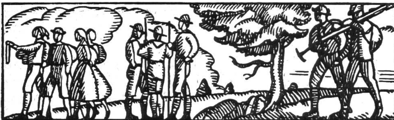
Wanderer und Pfadfinder.

nach ihren eigenen Idealen u. nach ihrer Sehnsucht gestalten können. Seine kleinen und grossen Fahrten, im Sommer und im Winter, zu Fuss und auf den Brettern, führen ihn weit herum im lieben Heimatlande und lassen ihn in goldener Freiheit viel Herrliches erleben. Ganz besonders sucht der Wandervogel seine Mitglieder in den Kreisen der Mittel- und Sekundarschüler. Für weitere Schülerkreise werden jeweilen in den Ferien besondere Schülerfahrten veranstaltet. Ausser den Fahrten bietet der Wandervogel noch Raum allen den Bestrebungen, die aus dem Gemeinschaftsleben seiner Mitglieder herauswachsen, insbesondere allen den Bestrebungen, die für das Leben der Jugend eintreten.