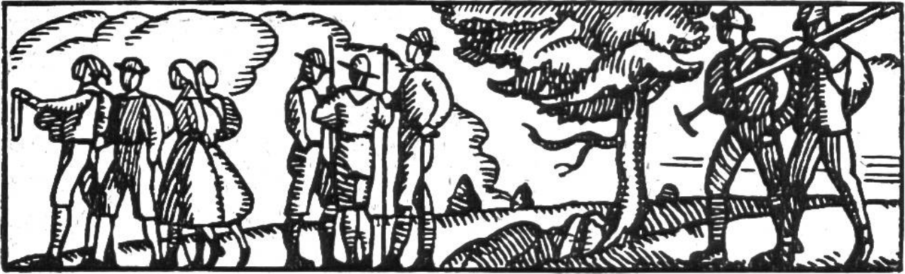
Wanderer und Pfadfinder.

nach ihren eigenen Idealen u. nach ihrer Sehnsucht gestalten können. Seine kleinen und grossen Fahrten, im Sommer und im Winter, zu Fuss und auf den Brettern, führen ihn weit herum im lieben Heimatlande und lassen ihn in goldener Freiheit viel Herrliches erleben. Ganz besonders sucht der Wandervogel seine Mitglieder in den Kreisen der Mittel- und Sekundarschüler. Für weitere Schülerkreise werden jeweilen in den Ferien besondere Schülerfahrten veranstaltet. Ausser den Fahrten bietet der Wandervogel noch Raum allen den Bestrebungen, die aus dem Gemeinschaftsleben seiner Mitglieder herauswachsen, insbesondere allen den Bestrebungen, die für das Leben der Jugend eintreten.