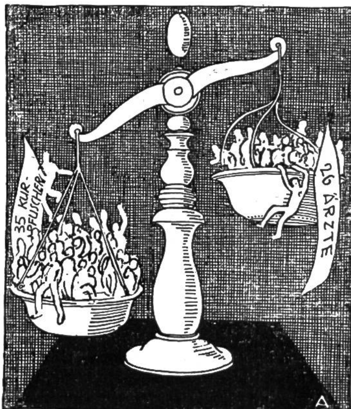
Kurpfuscher und Ärzte im Kanton Appenzell.