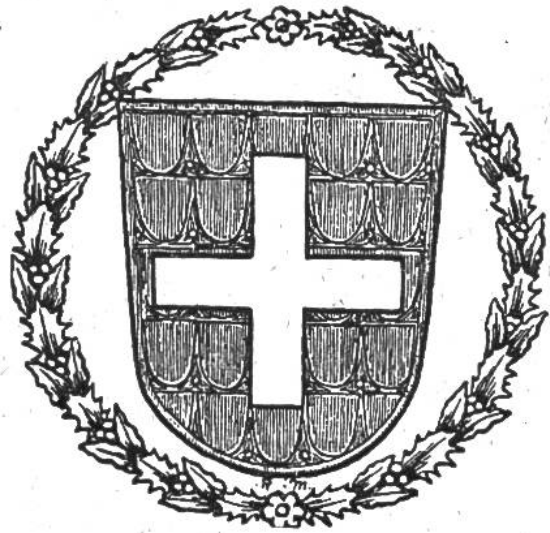
WAPPEN auf dem Titelblatt „Die Schweizerfahne v. Charles Borgeaud“ (Sonderdruck aus der Schweiz. Kriegsgeschichte), gezeichnet von Maler und Heraldiker R. Mürger, Bern.