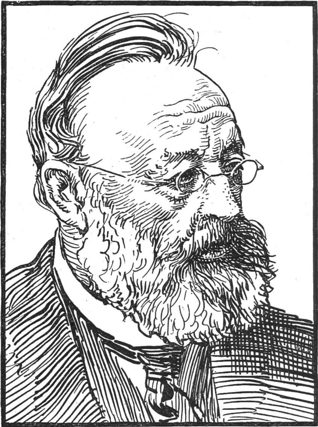
GOTTFRIED KELLER ZU SEINEM 100sten GEBURTSTAGE geb. 19. JULI 1819.