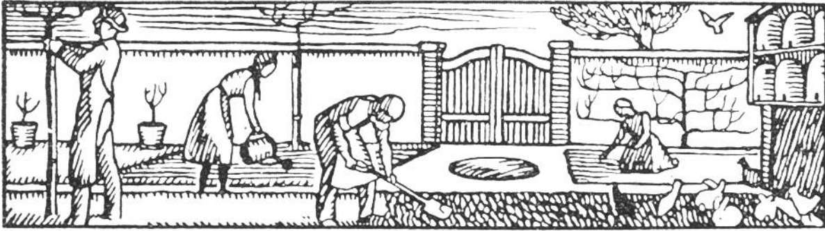
Hauswirtschaft und Garten.