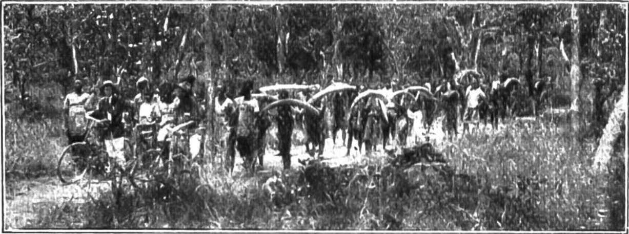
Elfenbeinkarawane auf dem Marsch.

Zahn eine Summe von Fr. 1500—2000. Es ist daher begreiflich, dass in Afrika grosse Elefanten-Treibjagden veranstaltet werden. Die mit den besten Waffen versehenen Jäger erlegen die Tiere; die Zähne werden mühsam herausgehauen. Gewöhnlich beansprucht der Negerhäuptling, auf dessen Gebiet der Elefant erlegt wurde, einen von den beiden Stosszähnen des Tieres. Grosse Karawanen bringen das Elfenbein an die Küste. Von etwa 900,000 kg Elfenbein, die jährlich verkauft werden, kommen rund 850,000 kg im Werte von 25 Millionen Franken aus Afrika. Der afrikanische Elefant ist aber auch dem Aussterben nahe, und nur die strengen Jagdgesetze, welche besonders die britische Regierung für ihre Gebiete erlassen hat, schützen das Tier vor der völligen Ausrottung.