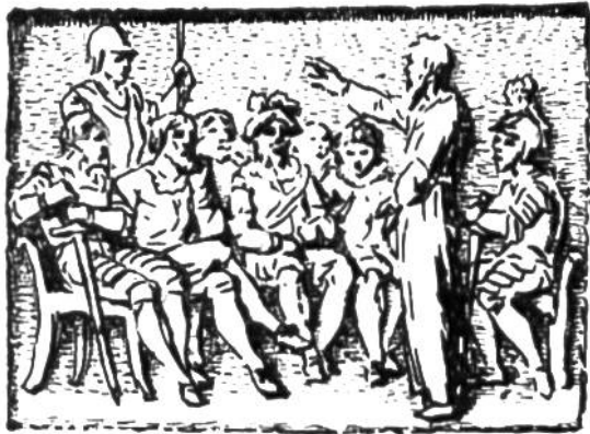
Niklaus von der Flüe an der Tagsatzung zu Stans. (Nach einem alten Stich.)

Das Schweizervolk gibt für die Erziehung, die Ausbildung und das Wohlergehen jedes Bürgers grosse Summen aus. Es will damit nicht nur den einzelnen befähigen, sich selbst zu erhalten, sondern jeden einzelnen zu einem nützlichen Gliede der Gemeinschaft und einer Stütze des Staates erziehen. Wer dazu befähigt ist und die Bildungsgelegenheit nicht nach Kräften nützt, wer die Hoffnung des Staates nicht rechtfertigt, wer seine Mitmenschen schädigt statt fördert, wer das Ansehen und die Kraft des Staates mindert, wer mehr Werte braucht, als er Werte schafft, in seinem Leben zehrt statt mehrt, der ist kein guter Eidgenosse.