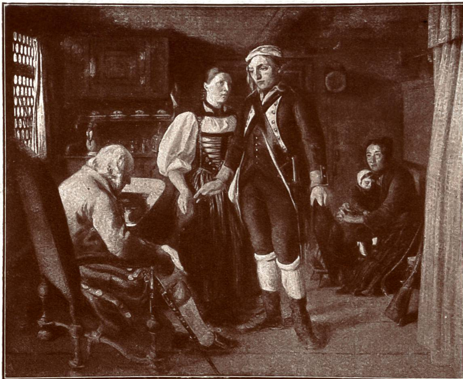
NACH DEM GEFECHT IM GRAUHOLZ 1798.