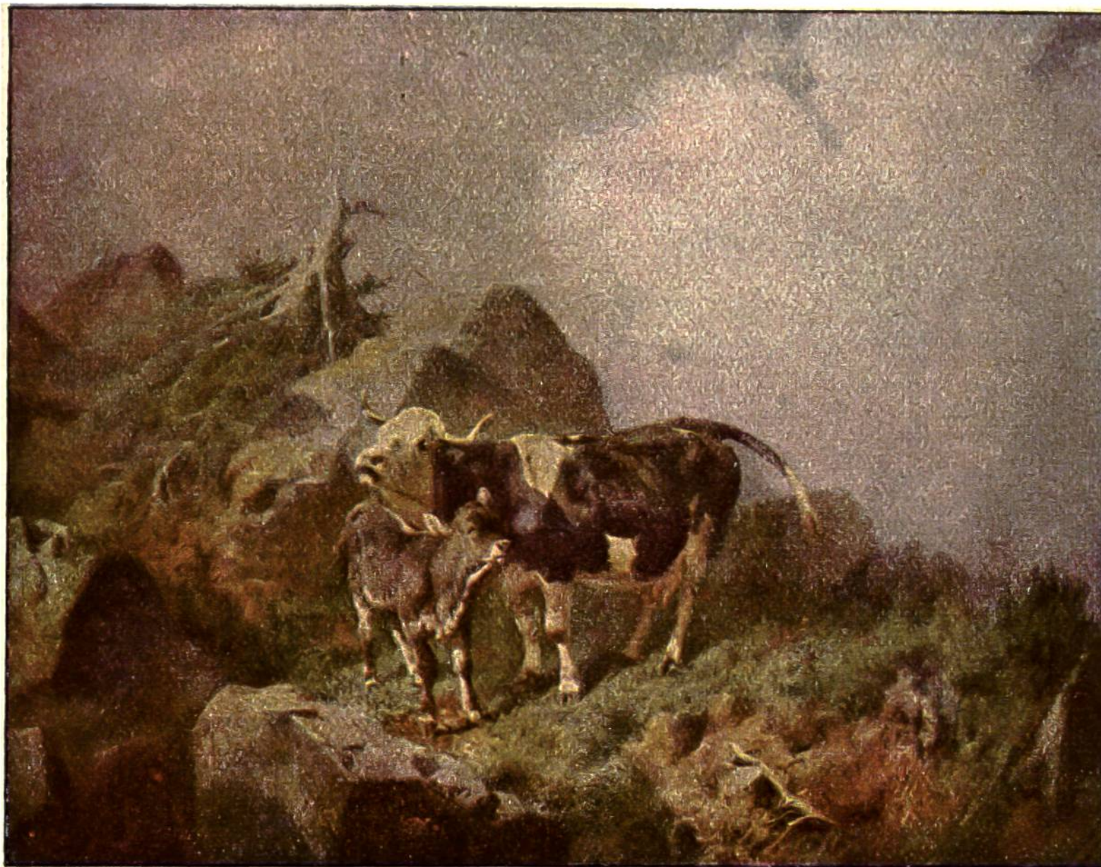
IM GEBIRGE VERIRRT.

R. Koller, Zürich 1828—1905 Kunst-Museum Bern.