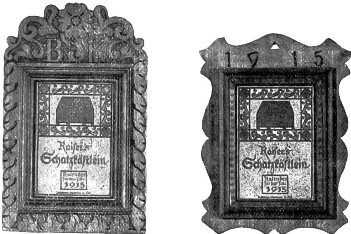
Rahmen für das Schatzkästlein des laufenden Jahres.

Frage sind wir auf die altertümlichen Kalenderhalter, die sich nun meist im Besitz von Museen und Kunstfreunden befinden, zurückgekommen. In einem Rahmen an der Wand bildet ein alter Jahrgang des Pestalozzikalenders einen hübschen Wandschmuck. Mehrere Kalender können mit kleiner Distanz nebeneinander aufgehängt werden. Sie nehmen sich als sogenannter „Fries“ sehr wirkungsvoll aus. Auch dem Kalenderbesitzer, der nicht die Werkzeuge hat, um sich solche Rahmen selbst herstellen zu können, suchten wir entgegenzukommen, indem wir in grosser Anzahl einfache, solide Rahmen, in welchen der Kalender und das dahinterstehende Schatzkästlein Platz haben, herstellen liessen. Diese Rahmen (siehe Abbildung Nr. 1) sind einzeln bei uns und bei den Wiederverkäufern der Pestalozzikalender zu dem erstaunlich billigen Preise von 70 Cts. erhältlich. Der neue Kalender, im Rahmen Nr. 1, um den letztjährigen Kalender aufbewahren zu können, kostet Fr. 2.20. Wer aber Lust und Gelegenheit hat, einen Rahmen selbst zu machen, den möchten wir ermuntern, es zu tun. Nachfolgend bringen wir diesen jungen Kunstgewerblern einige Abbildungen geschmackvoller Rahmen, die wir speziell für das Schatzkästlein bestimmt haben. Denn nicht nur die alten Jahrgänge, auch das Schatzkästlein des neuen Pestalozzikalenders wird, während ihr das Buch selbst