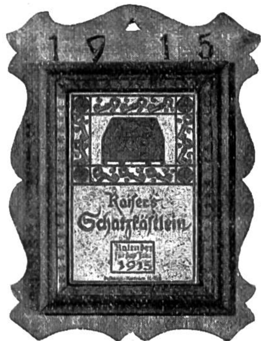
Rahmen für das Schatzkästlein des laufenden Jahres.