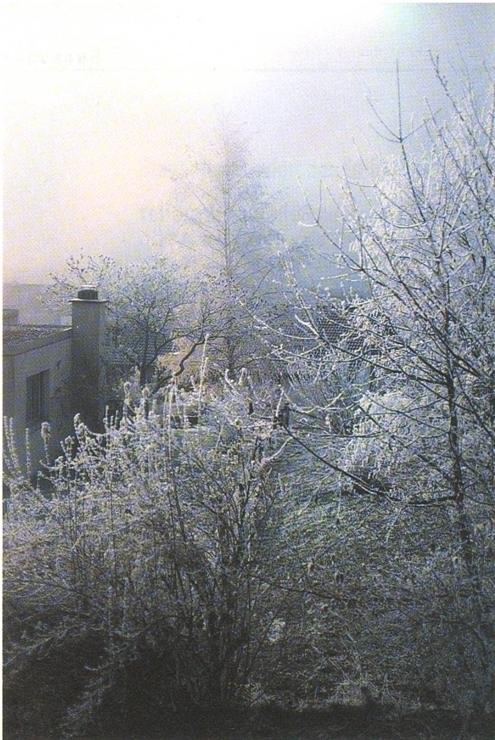
Staunen über die wunderbare Verwandlung der Landschaft nach einer Rauheif-Nacht

mit blosser Konzentration Löffel verbiegen oder Uhren stillstehen lassen. Aber wenn wir uns mit der Hand an die Stirn schlagen vor Verblüffung, dann tun wir genau dasselbe: Wir setzen einen geistigen Impuls in Bewegung um. Unser Medium dazu ist das Gehirn, unser Werkzeug die eigenen Glieder. Und kein Mensch weiss, wie das geht. Und kein Mensch wundert sich darüber. Ist das nicht seltsam? Wenn wir lernen könnten, über solche sensationellen Alltagsdinge zu staunen, dann würden wir vielleicht mehr darüber nachdenken. Und wer weiss – vielleicht würde dieses Nachdenken zu einem neuen Forschungszweig führen, der wiederum ungeahnte Auswirkungen auf unser Weltbild und unseren Alltag haben könnte.