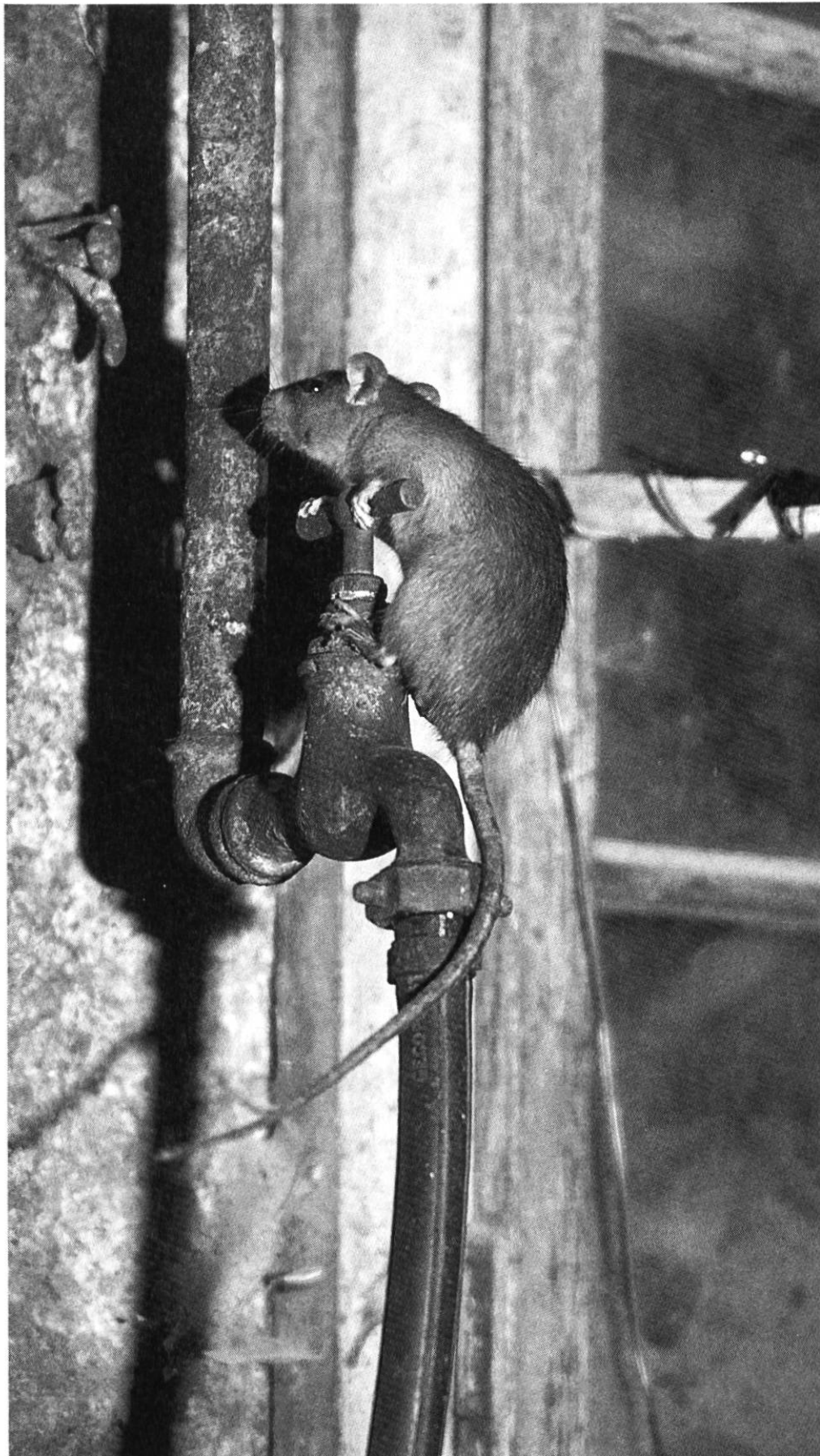
Eine seltene, grau-braune Farbvariante der Hausratte. Geschickt benutzt das Tier einen Wasserschlauch und ein Leitungsrohr, um die Stallwand hochzuklettern. Oben an der Decke führt ein Schlupfloch auf den Heuboden.