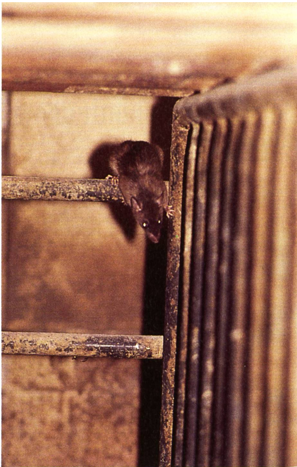
Auf der Flucht vor dem Fotografen turnt die Ratte geschickt an den Eisenstäben eines Schweinestalls herum.

bevorzugt. Normalerweise verteidigen die Männchen die Sippe gegen fremde Ratten, während die Rätinnen mit den Jungen beschäftigt sind. Aber im Notfall können die Rollen auch einmal vertauscht werden.